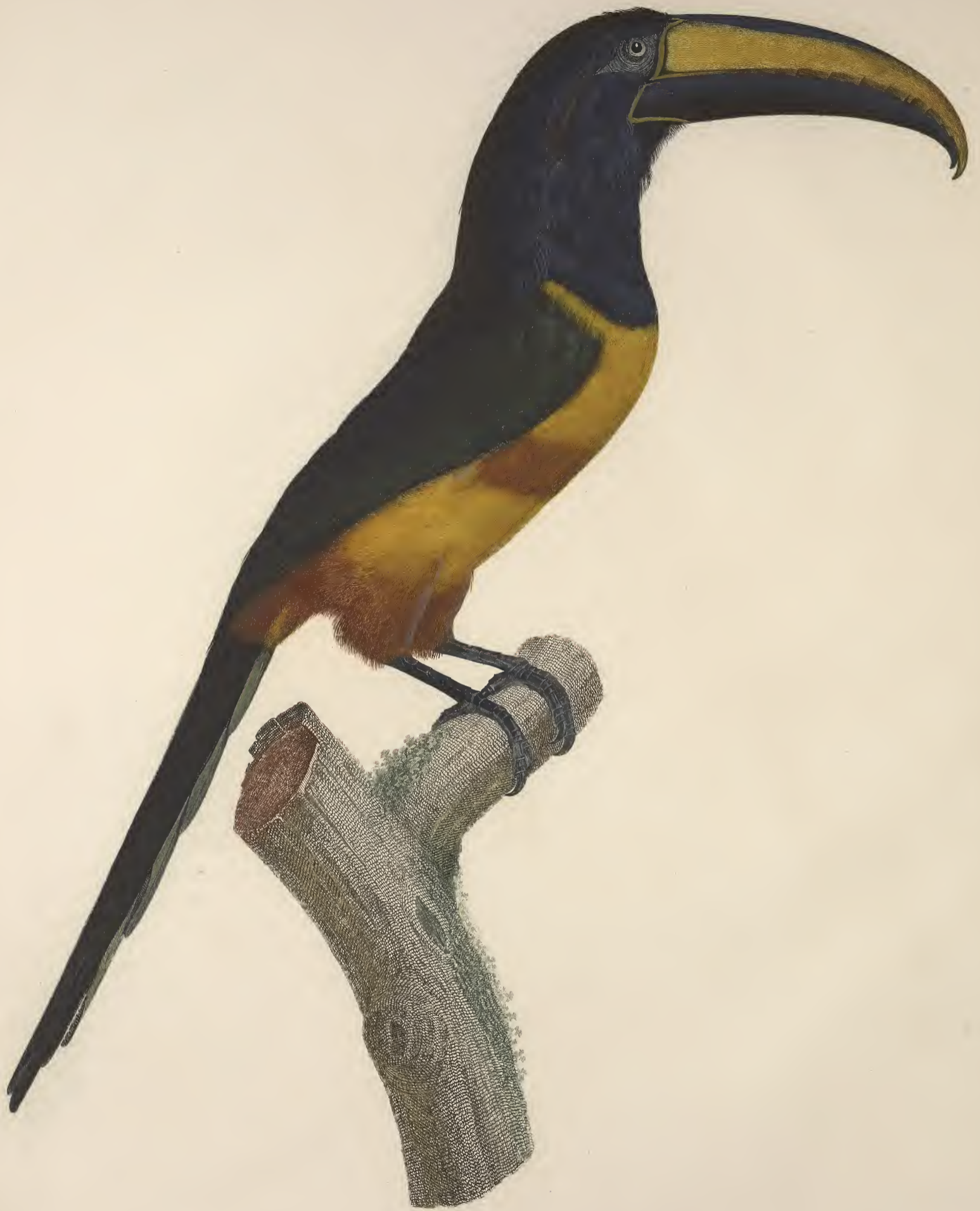
L'Aracari à ceinture rouge, dans son extrême vieillesse. N o 12.