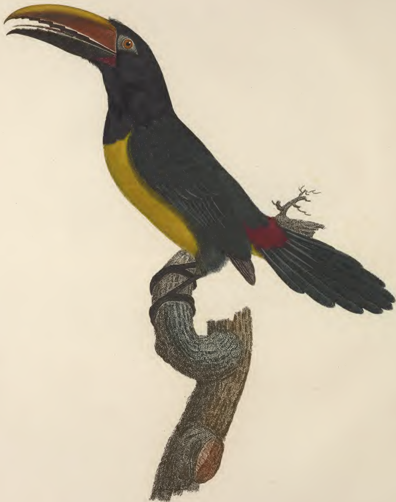
L'Aracari Vert mâle. n.º 16.