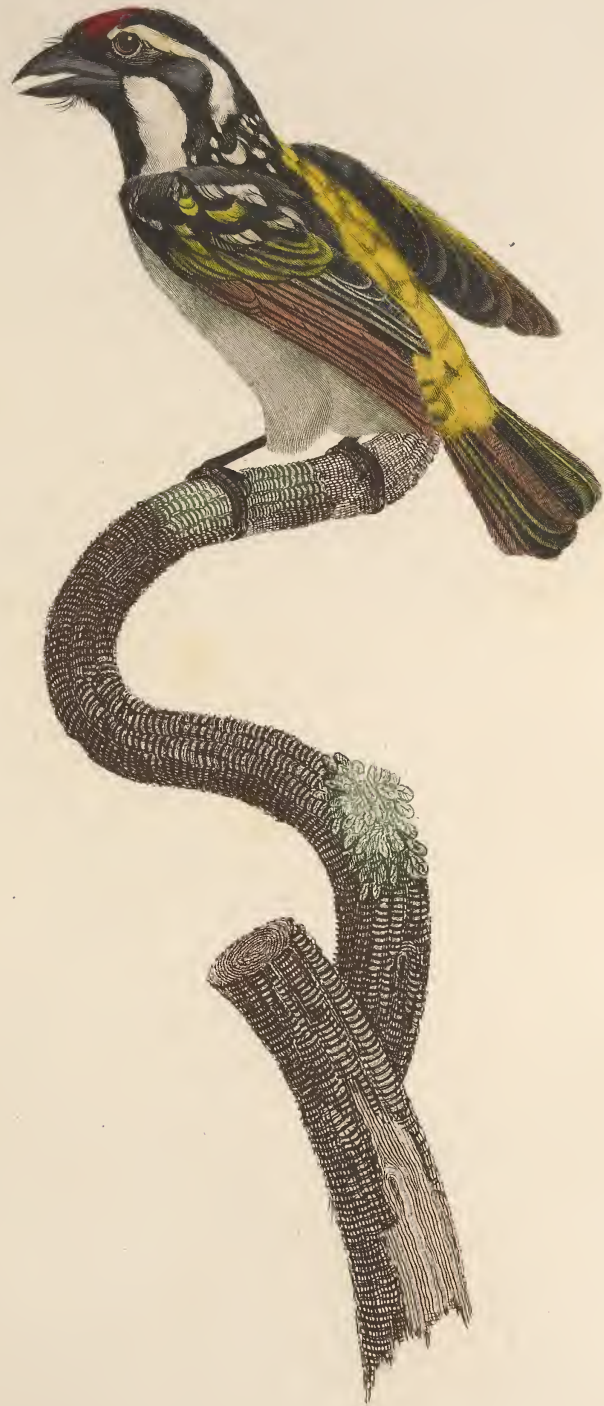
Le Barbu à gorge noire mâle. N o 29.