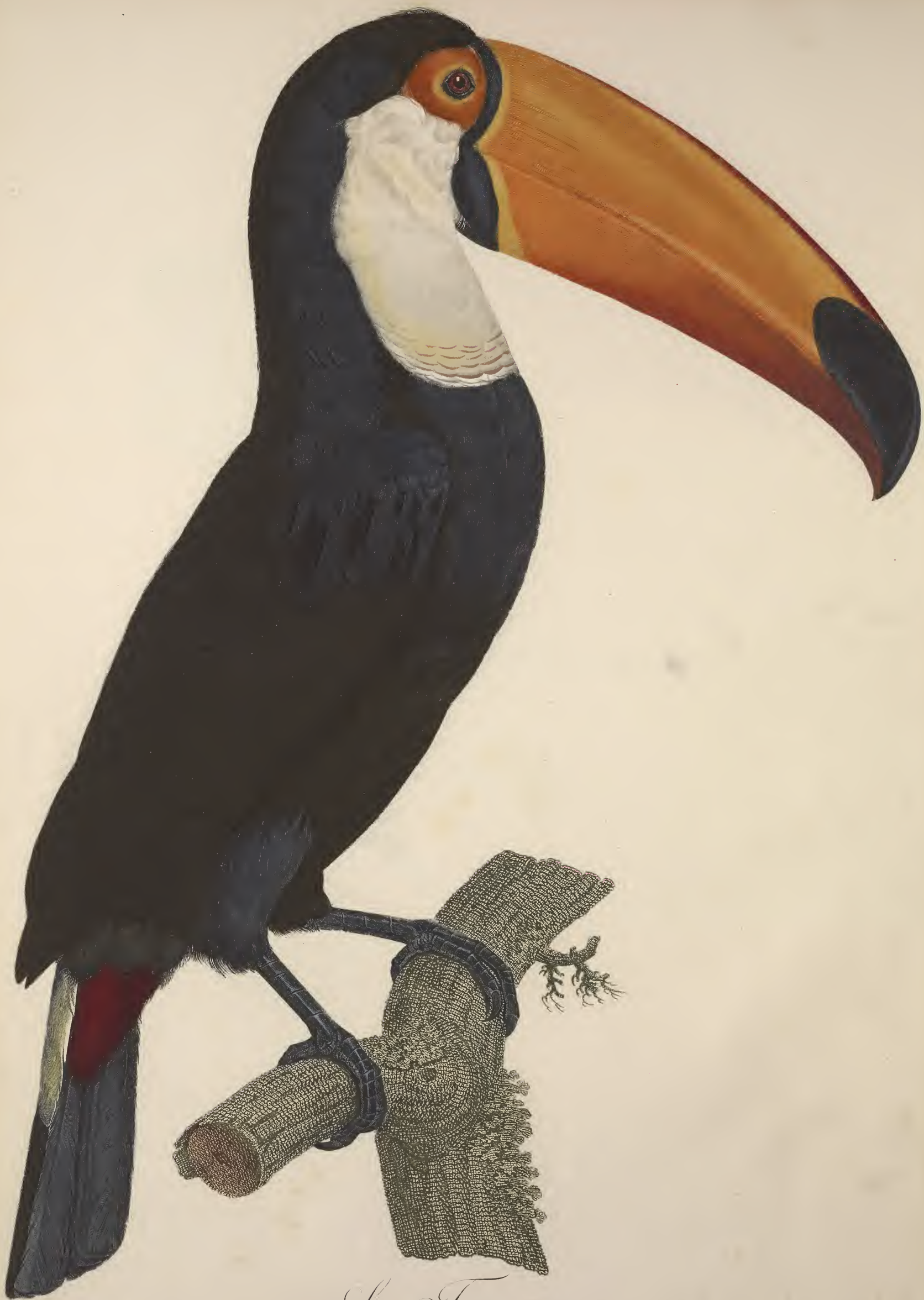
Le Toco. N.º 2.