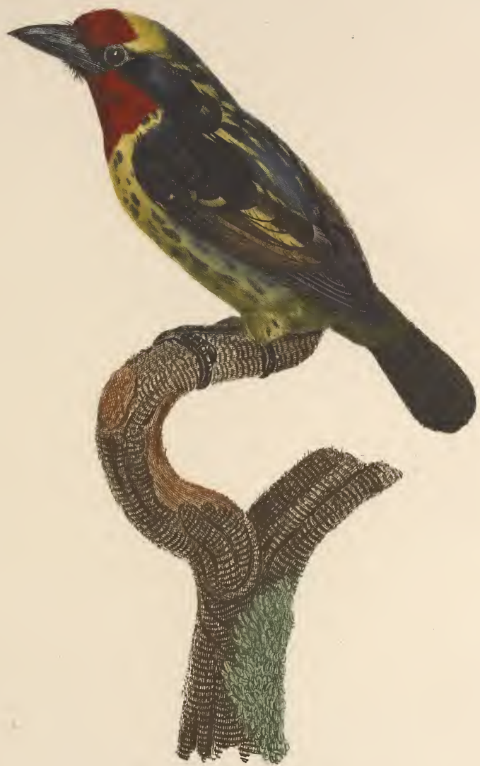
Le Barbicou de la Guyane mâle. n.º 23.