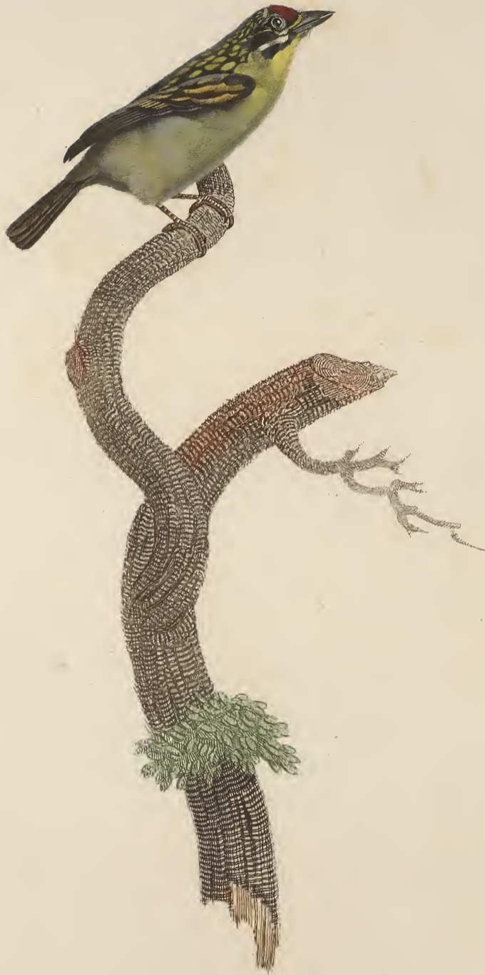
Le Barbion mâle. N.º 32.