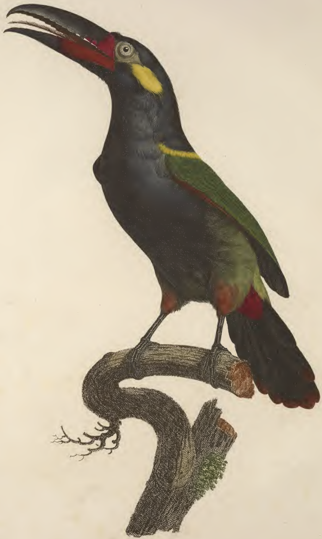
L'Aracari Kouluk mâle de la Guyane. n.º 13.