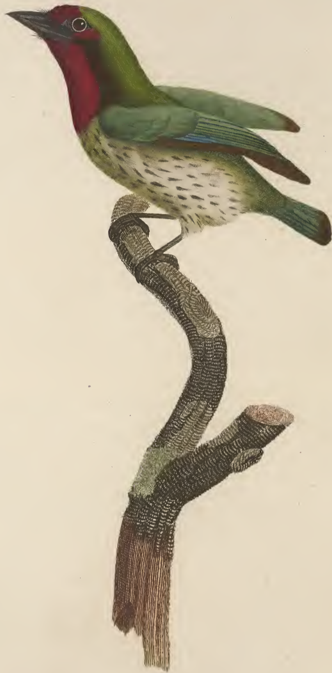
Le Barbu rose gorge. n. 33.