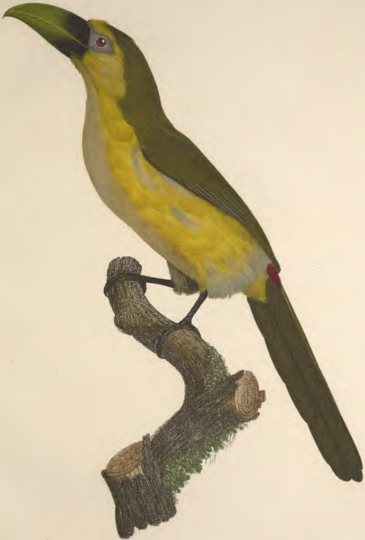
L'Aracari baillon. n.º 18.