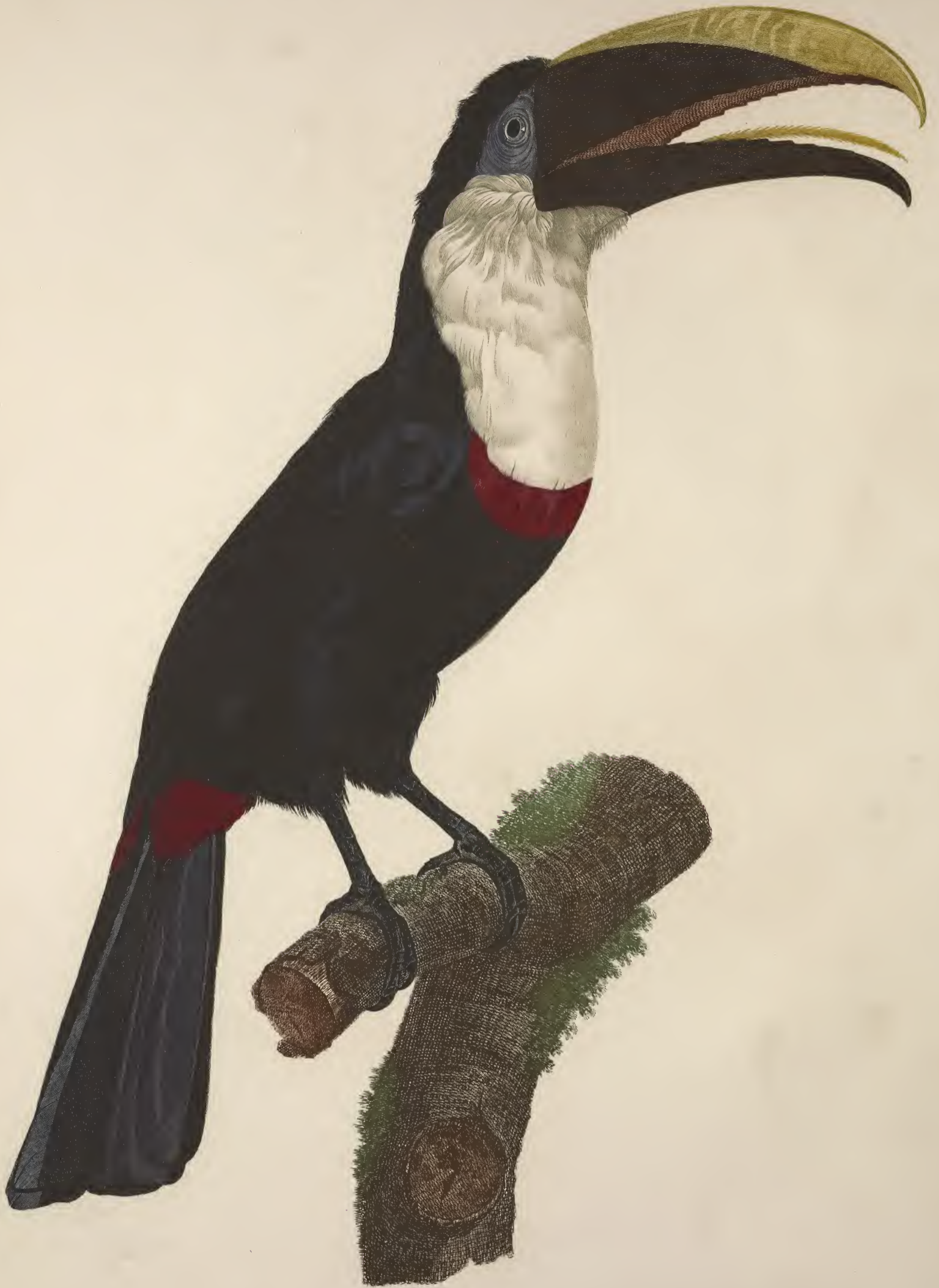
Le Tocard. N o 9.