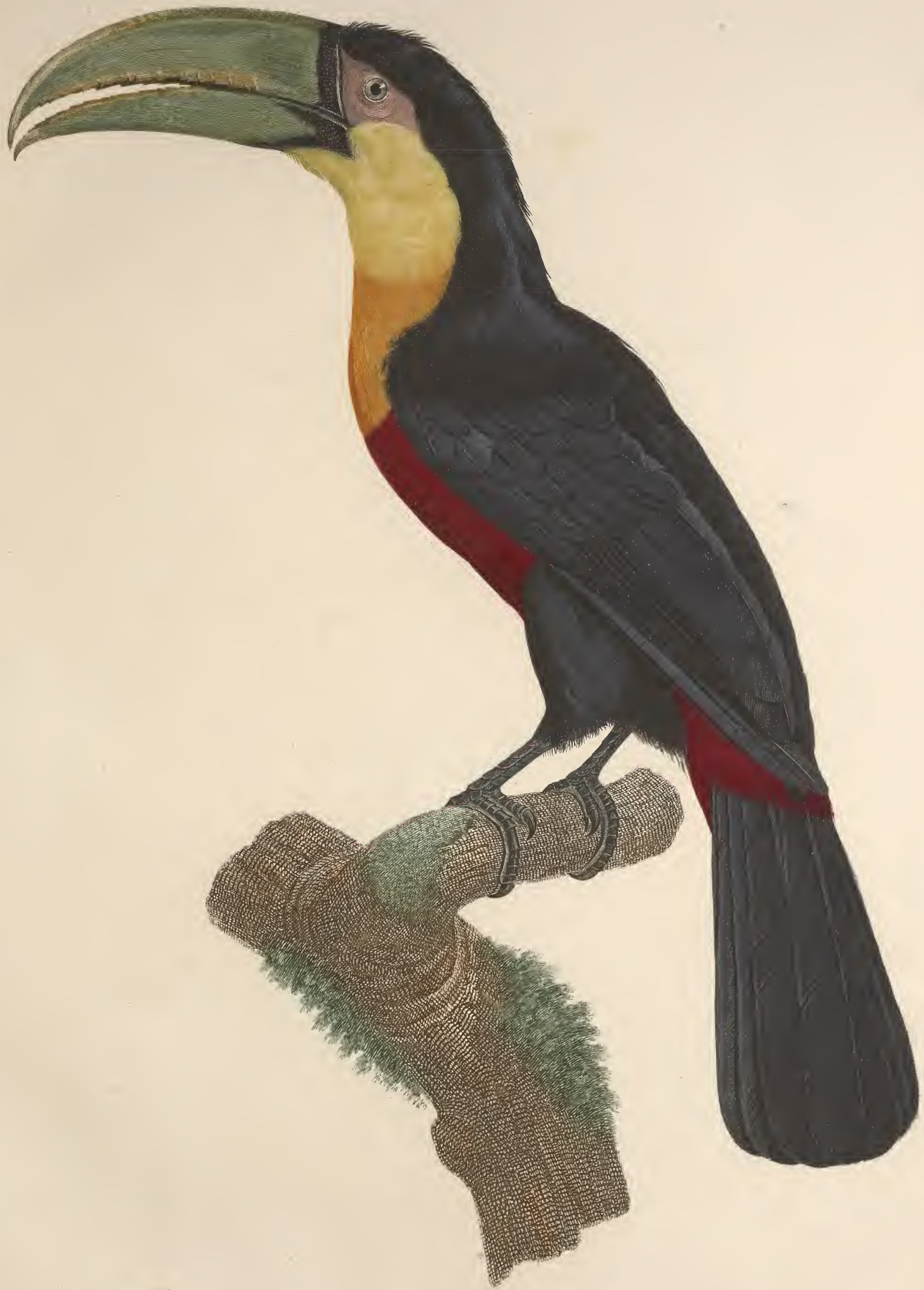
Le petit Toucan, à ventre rouge. N.º 8.