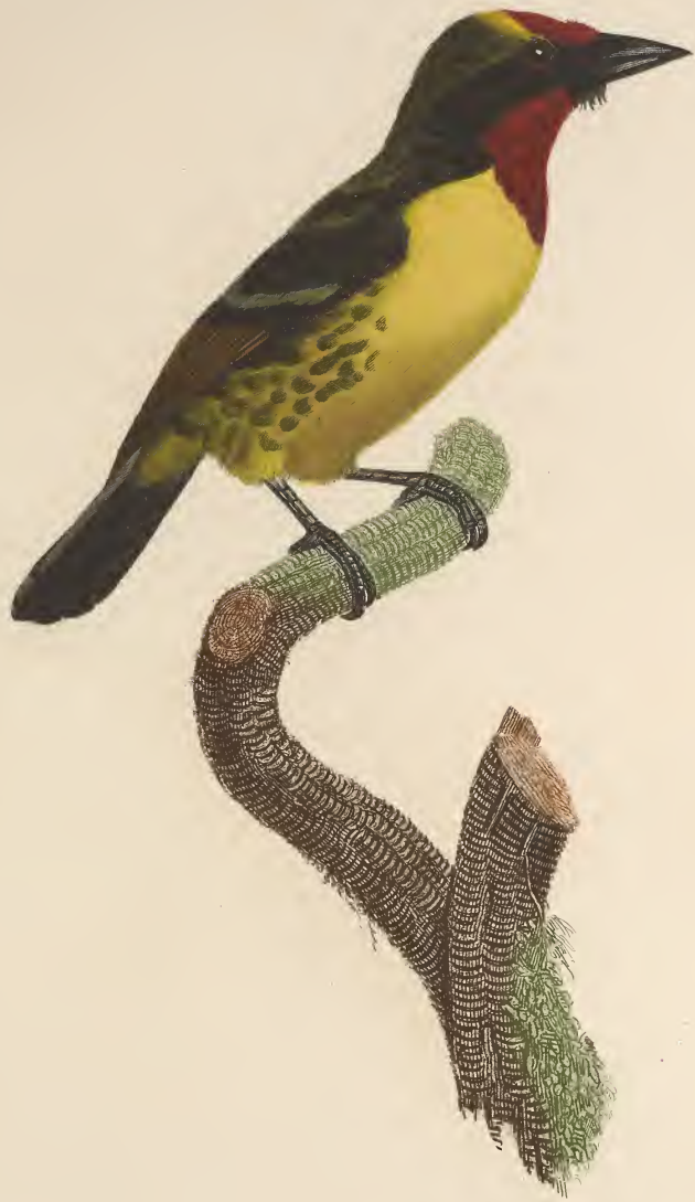
Le Barbud de la Guyane femelle. n.º 24.