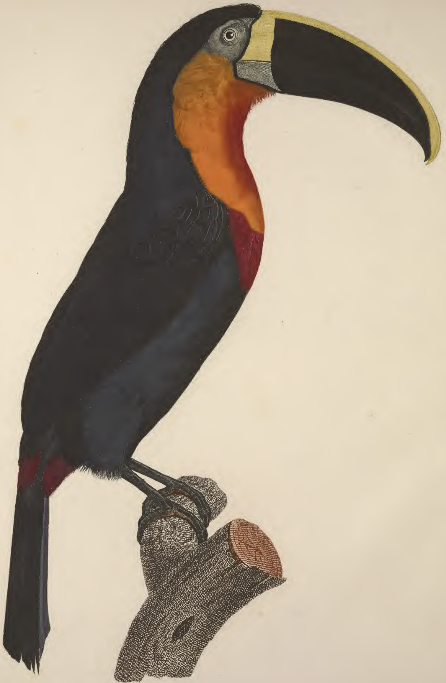
Le grand Toucan à gorge orange. N. 5.