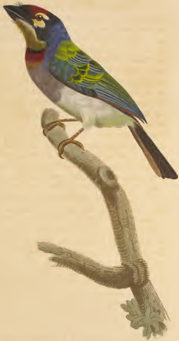
Le Barbu à collier rouge. n.º 55.