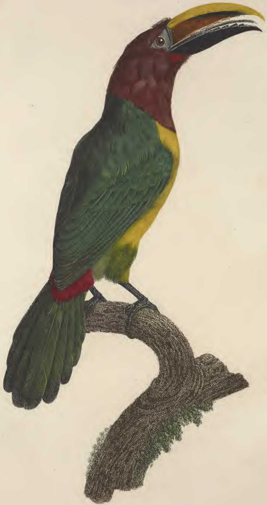
L'Aracari vert, femelle. N.º 17.