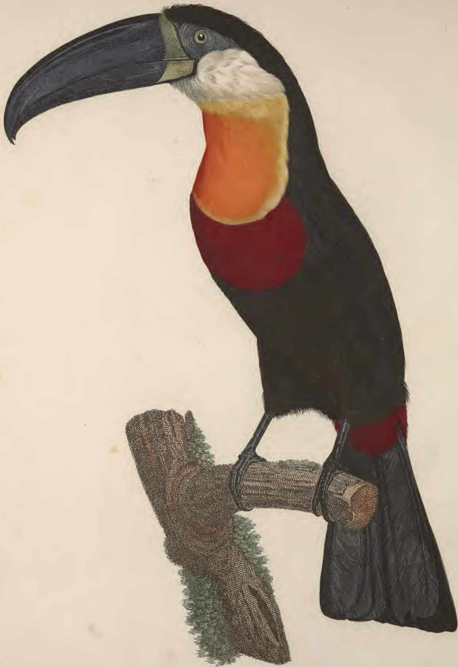
Le Tigancoin. n. 7.