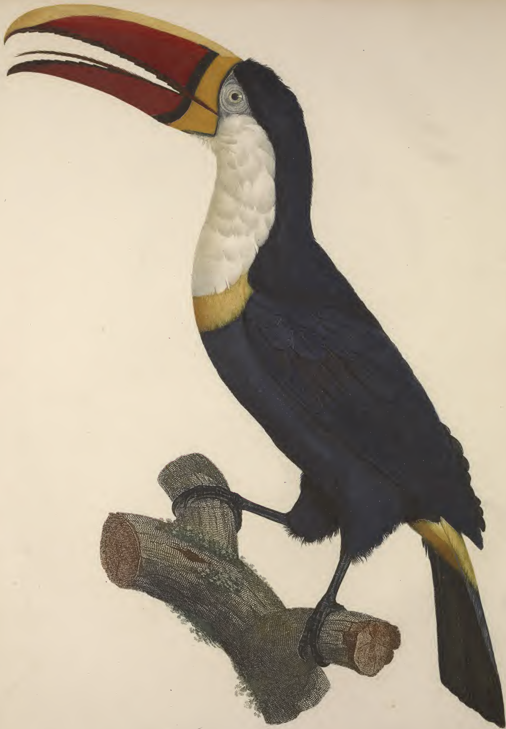
Le Toucan à Collier jaune. N. 4.