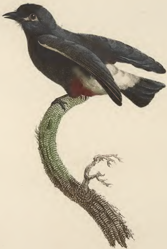
Le Barbacou à croupion blanc. n.º 46.