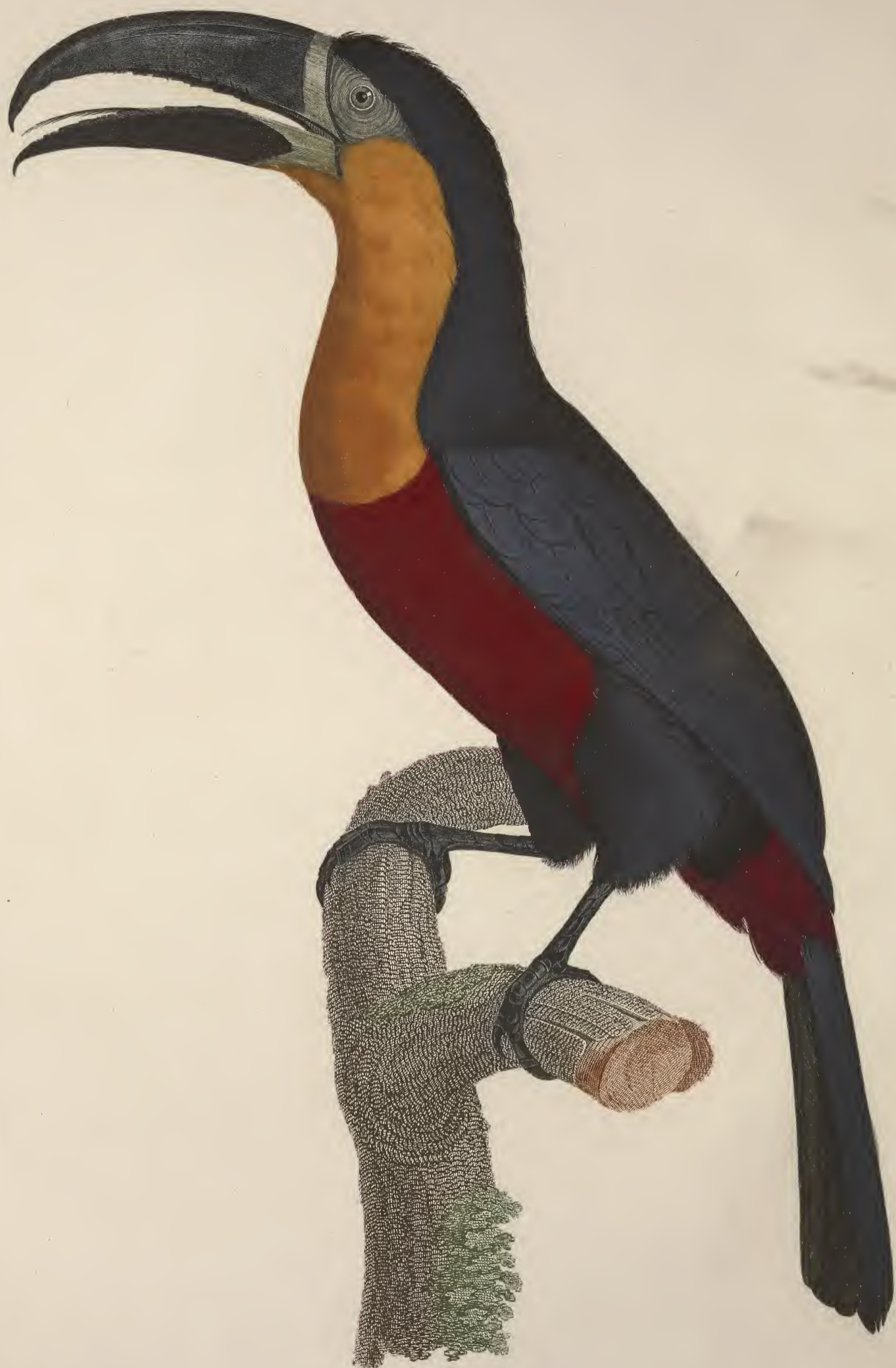
Le grand Toucan à ventre rouge. N.º 6