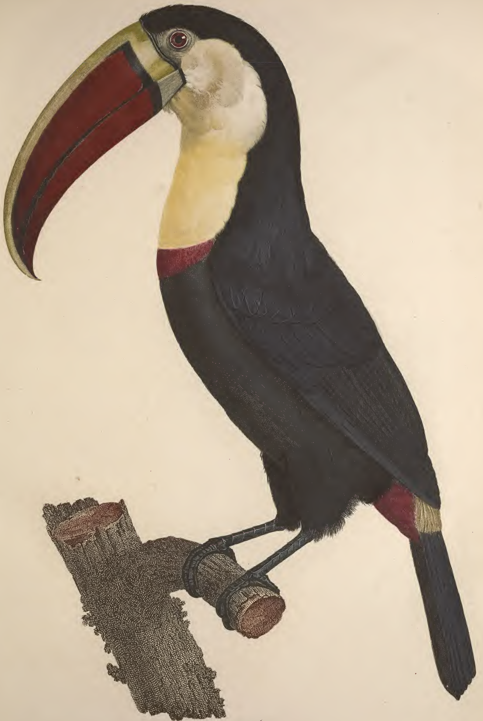
Le Tocan. N.º 3.