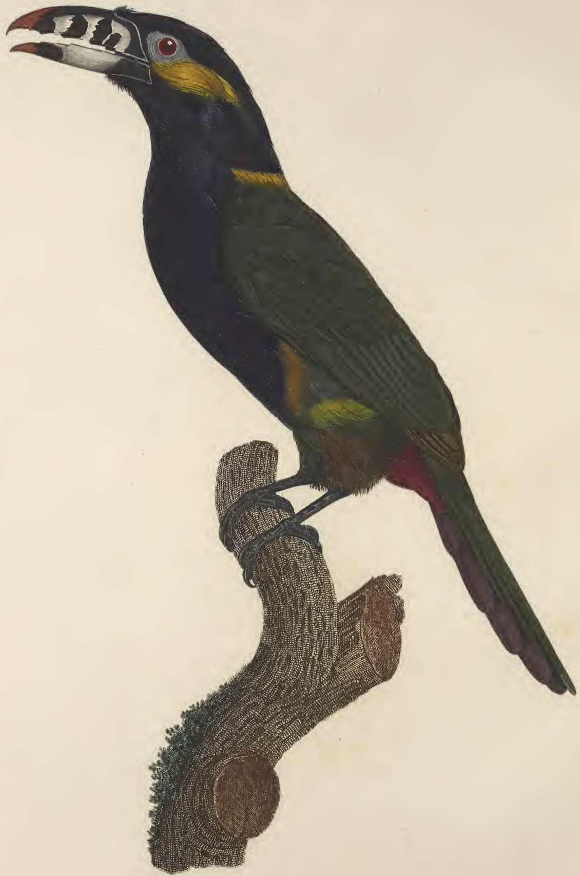
L'Aracari Koulik mâle du Brésil. n. 15.