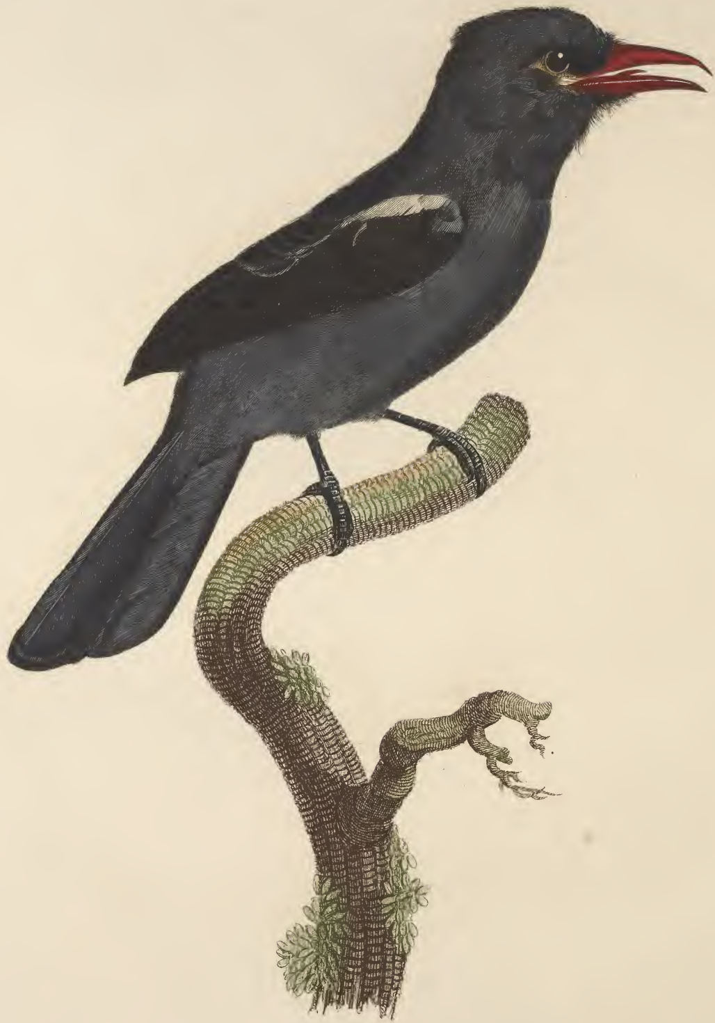
Le Barbacou à bec rouge, mâle. n.º 44.