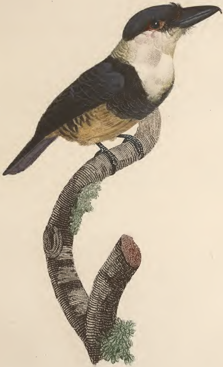
Le Tanager à plastron noir. N.º 39.