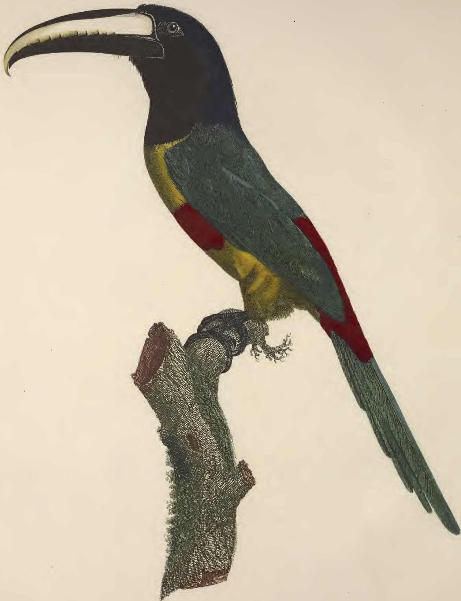
L'Aracari, à ceinture rouge : n. 10.