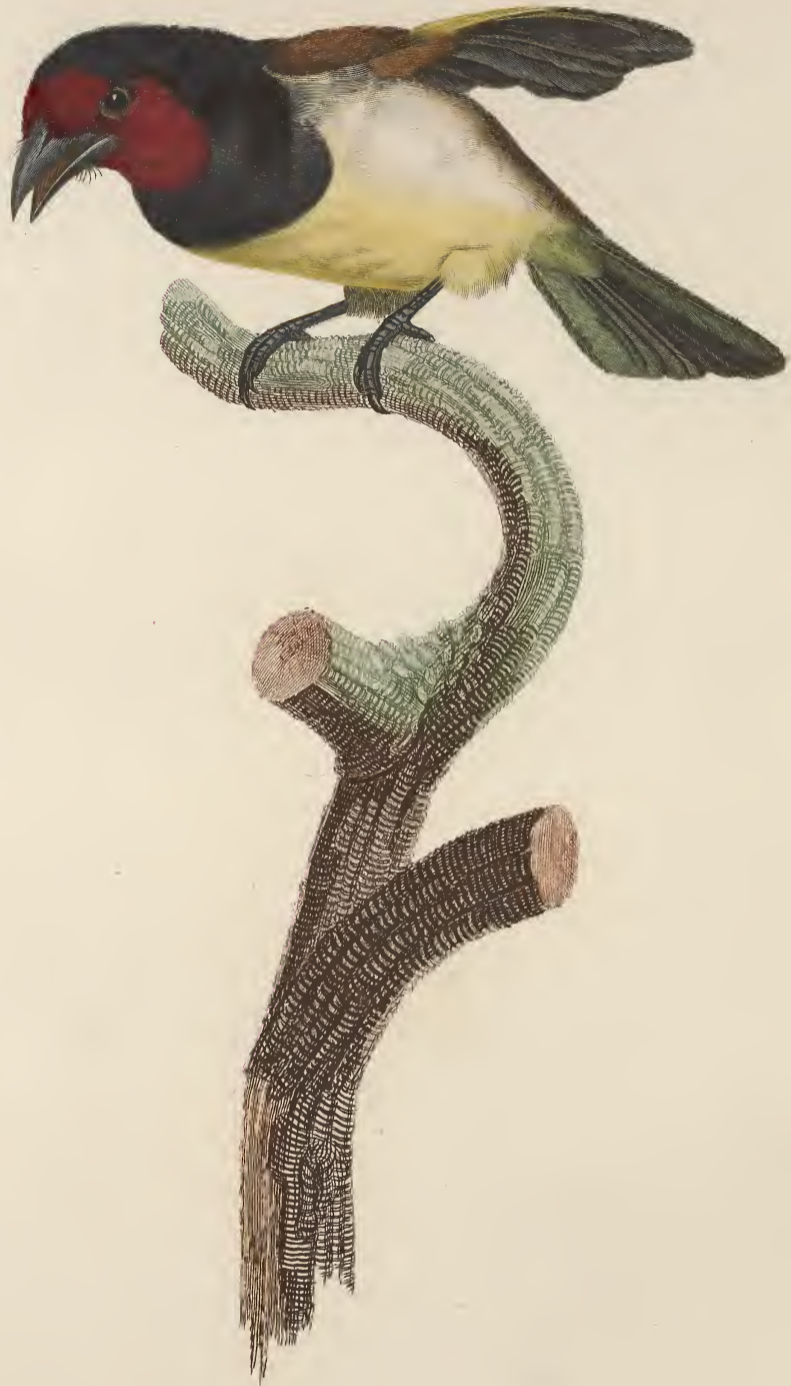
Le Barbu à plastron noir. N o 28.