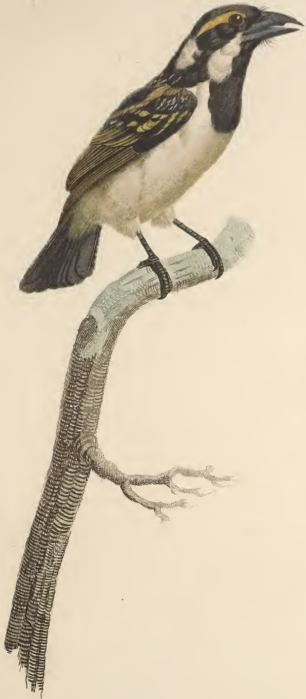
Le Barbu à gorge noire femelle. n.º 30.