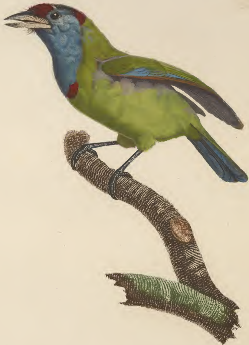
Le Barbu à gorge bleue mâle. N.º 21.