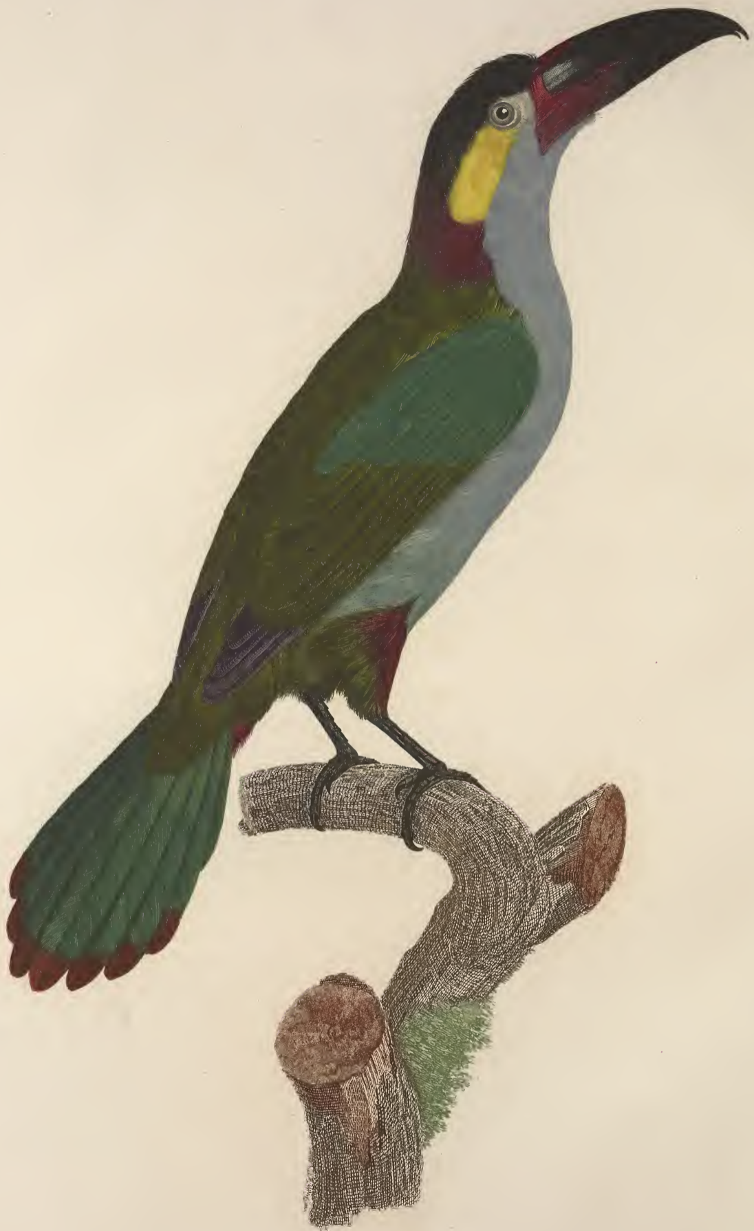
L'Aracari Kouluk femelle. n. 14.