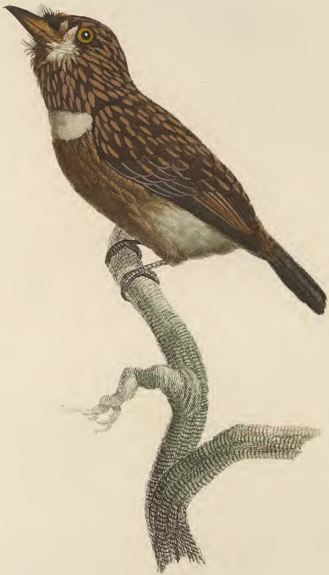
Le Tamatia brun. n.º 43.