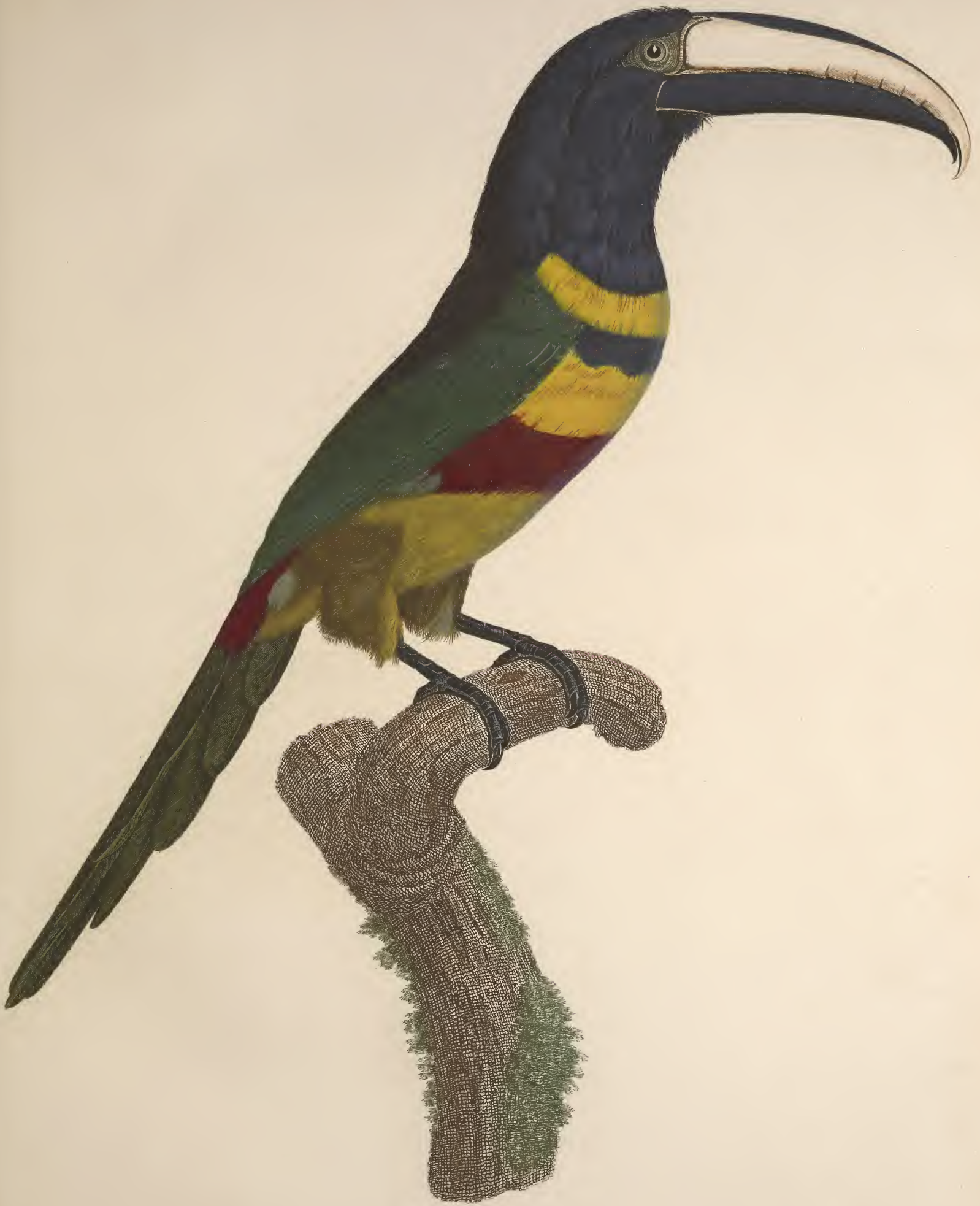
L'Aracari à double ceinture. N.° 11.