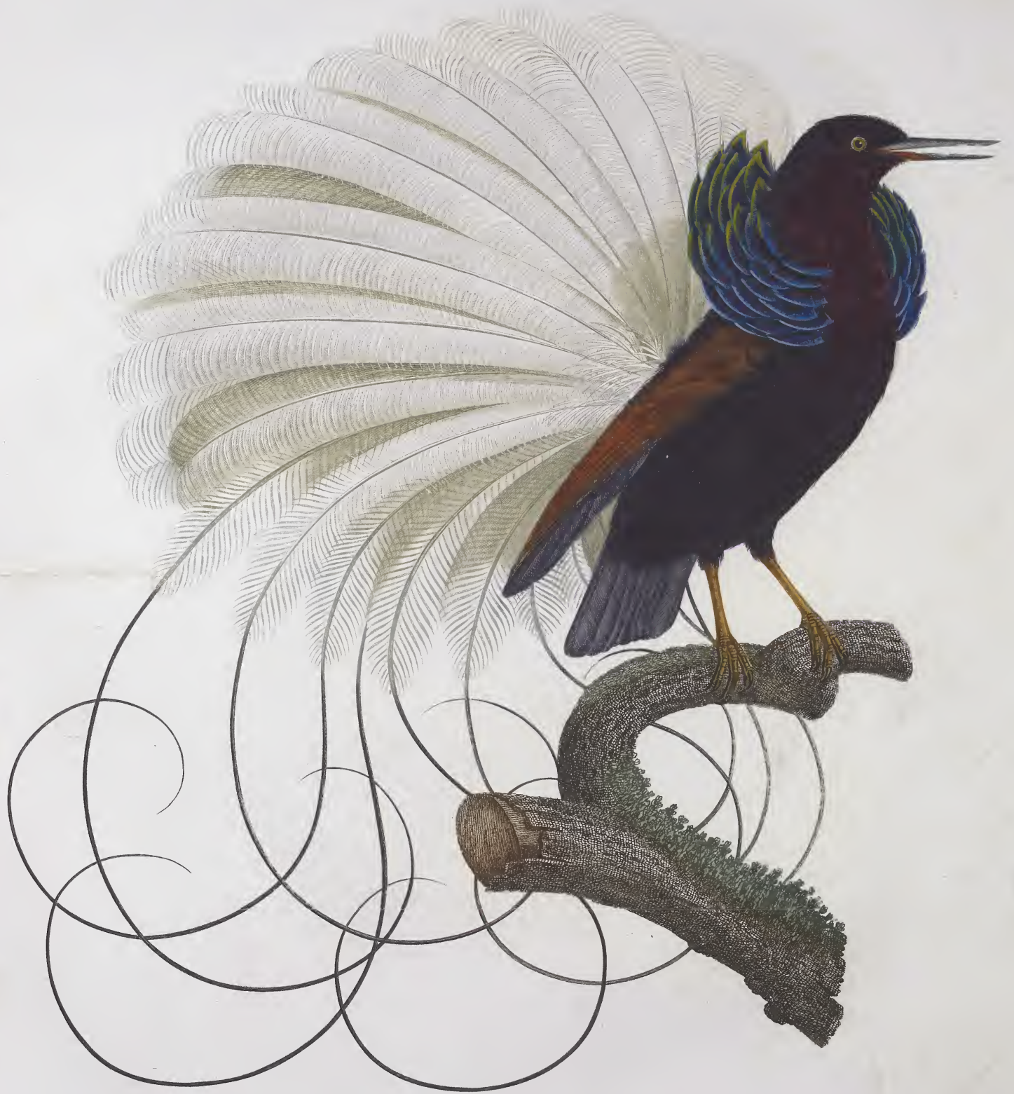
Le Nébuleux, étalant ses parures. Pl. 16.