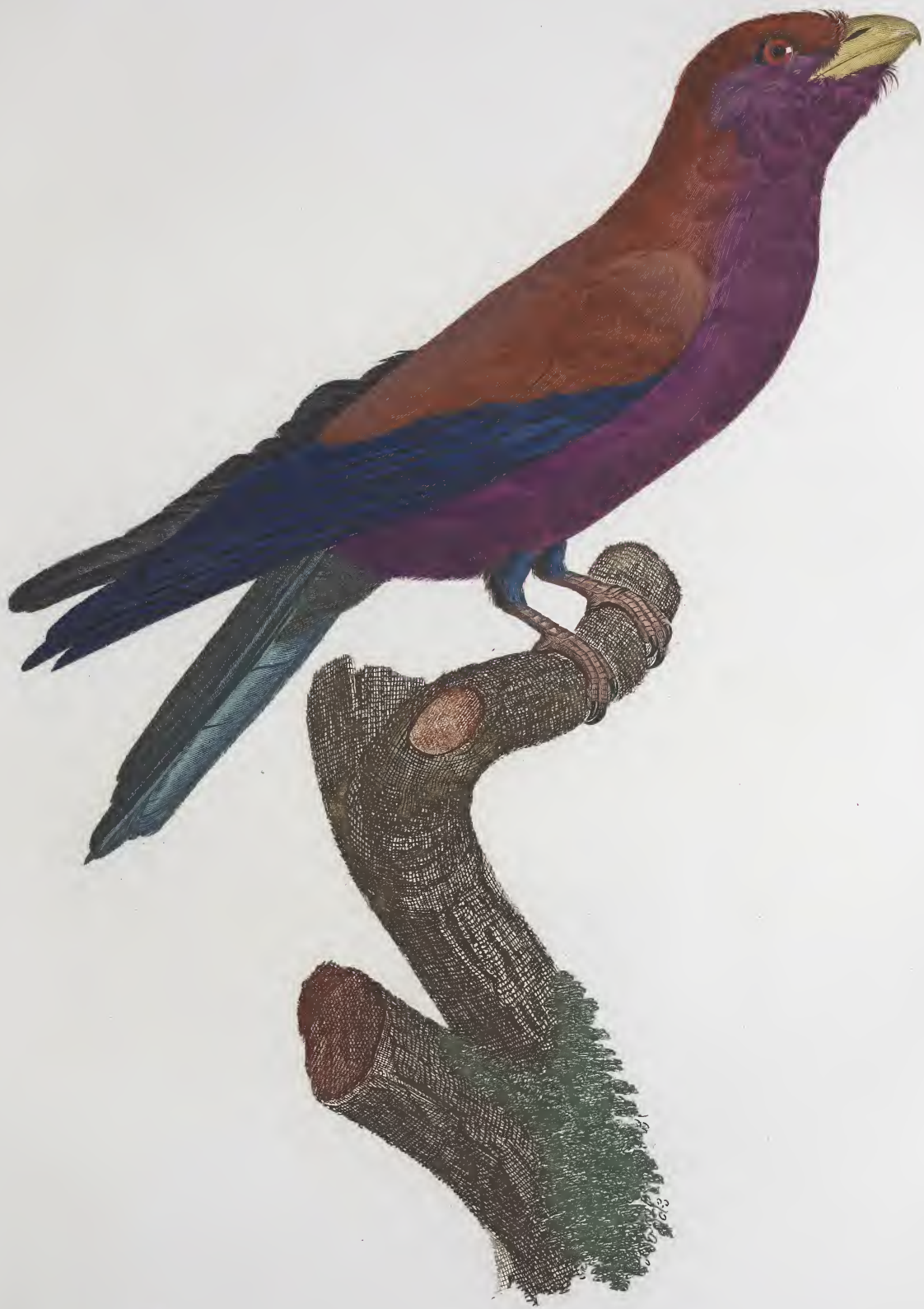
Le grand Rollet Violet . N.º 34.