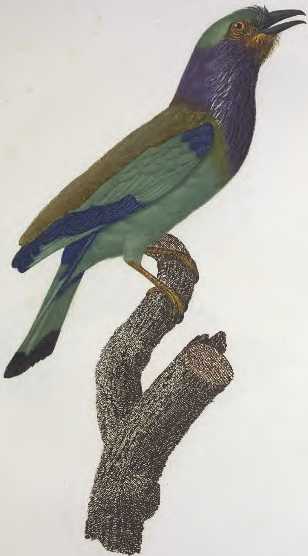
Le Pottier varié des Moluques. N o 27.