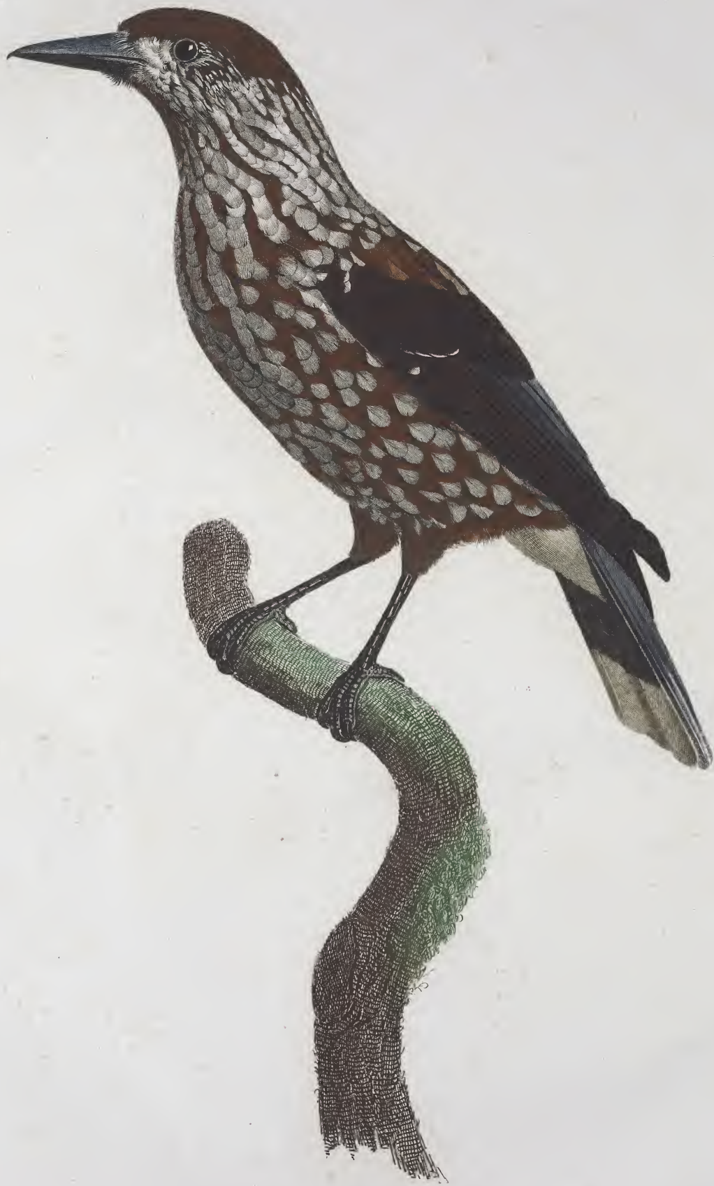
Le Casse noire . N.º 55.