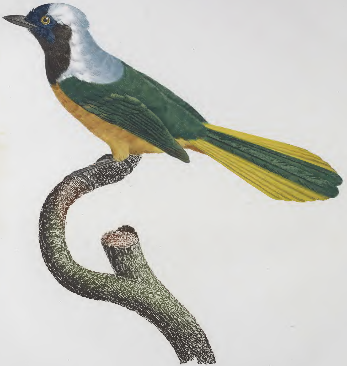
Le Geai Peruvien. n.º 46.