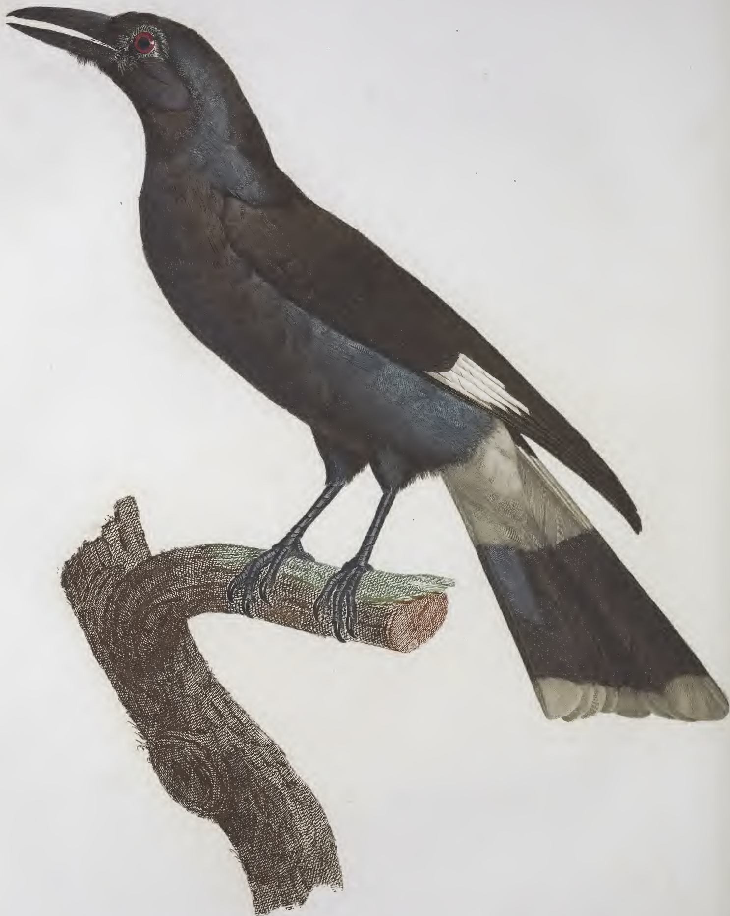
Le grand Calibé. n.º 24.