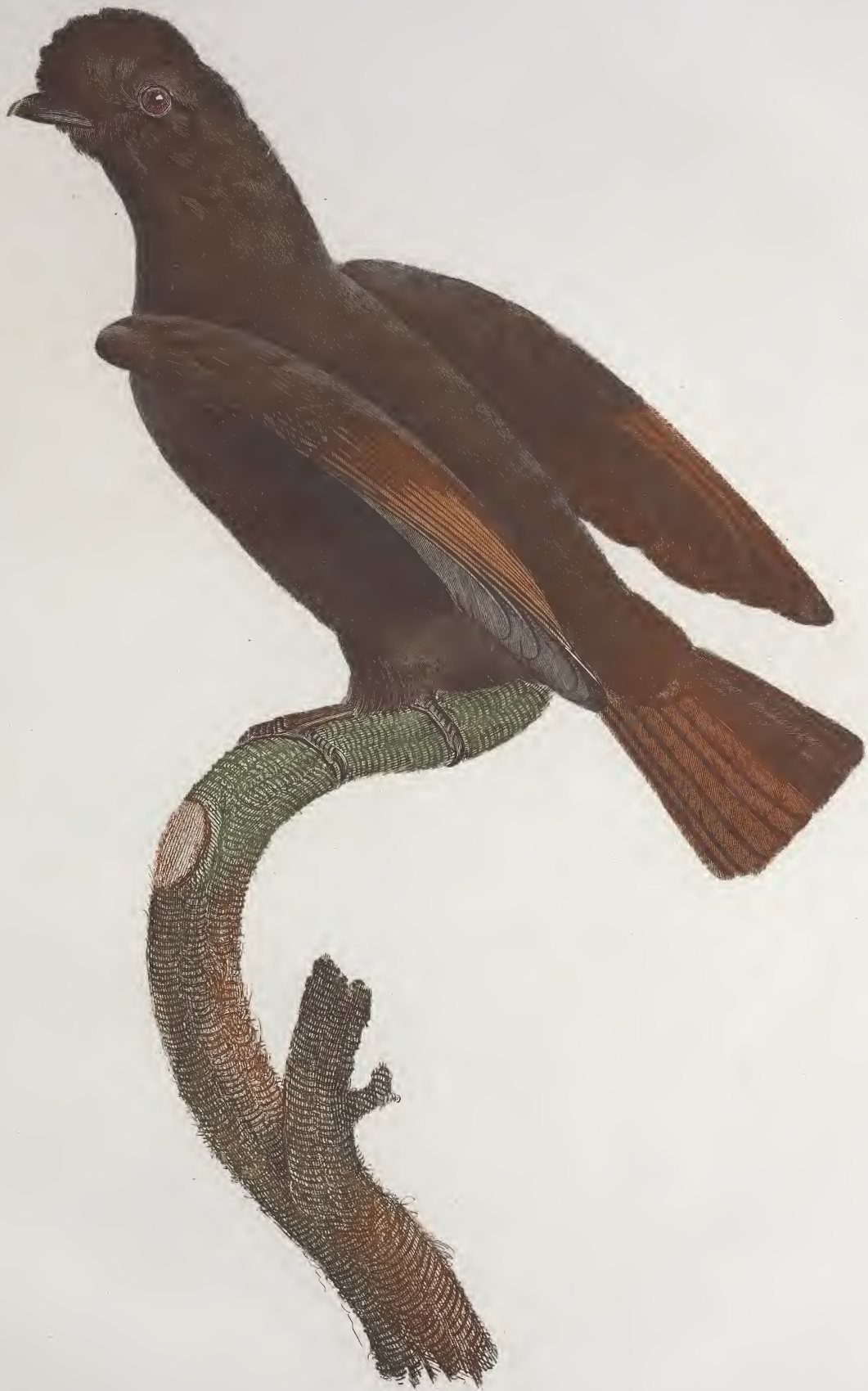
Le Coq de roche femelle. N.º 52.