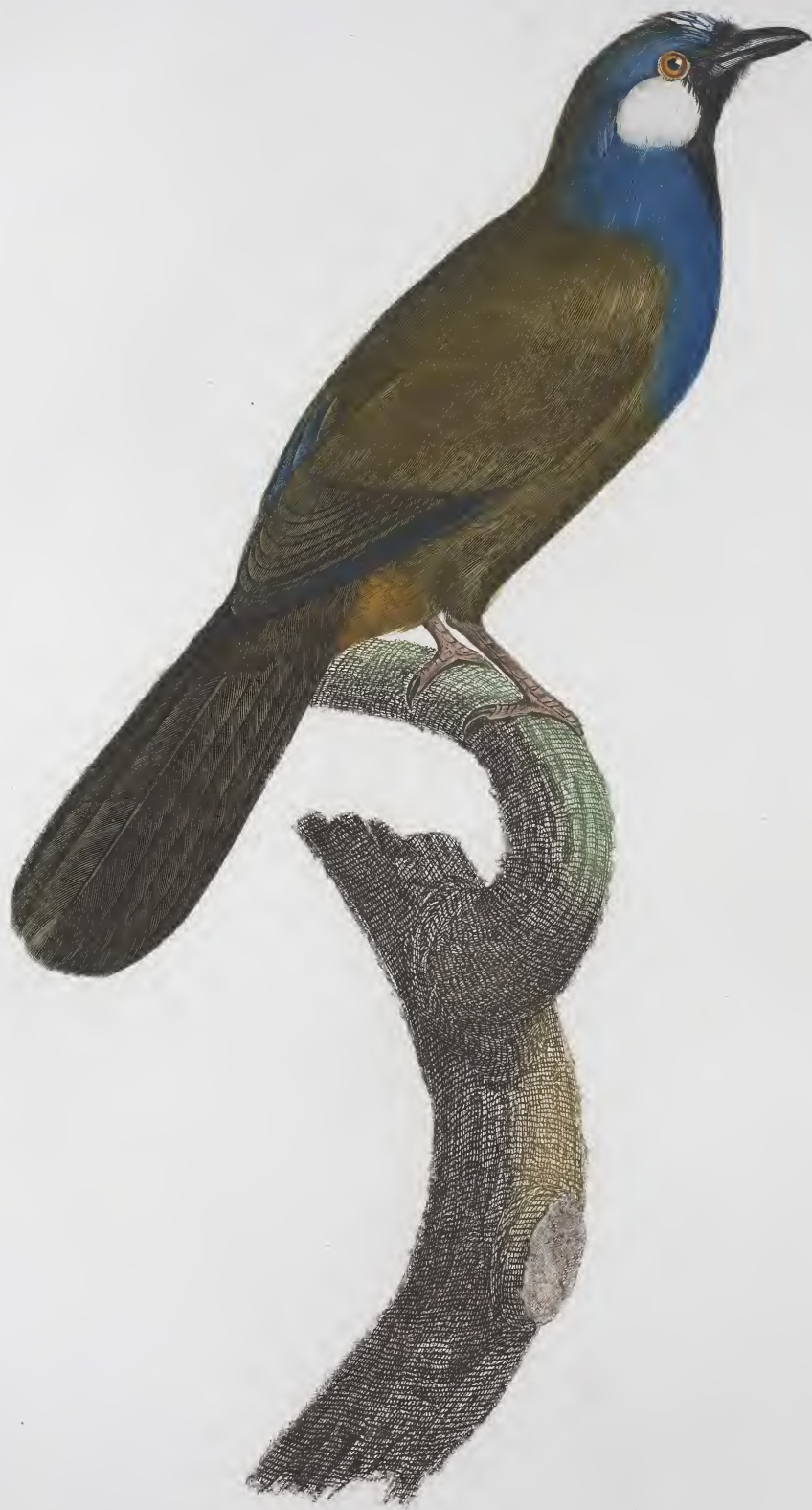
Le Geai à joues blanches. N° 43.