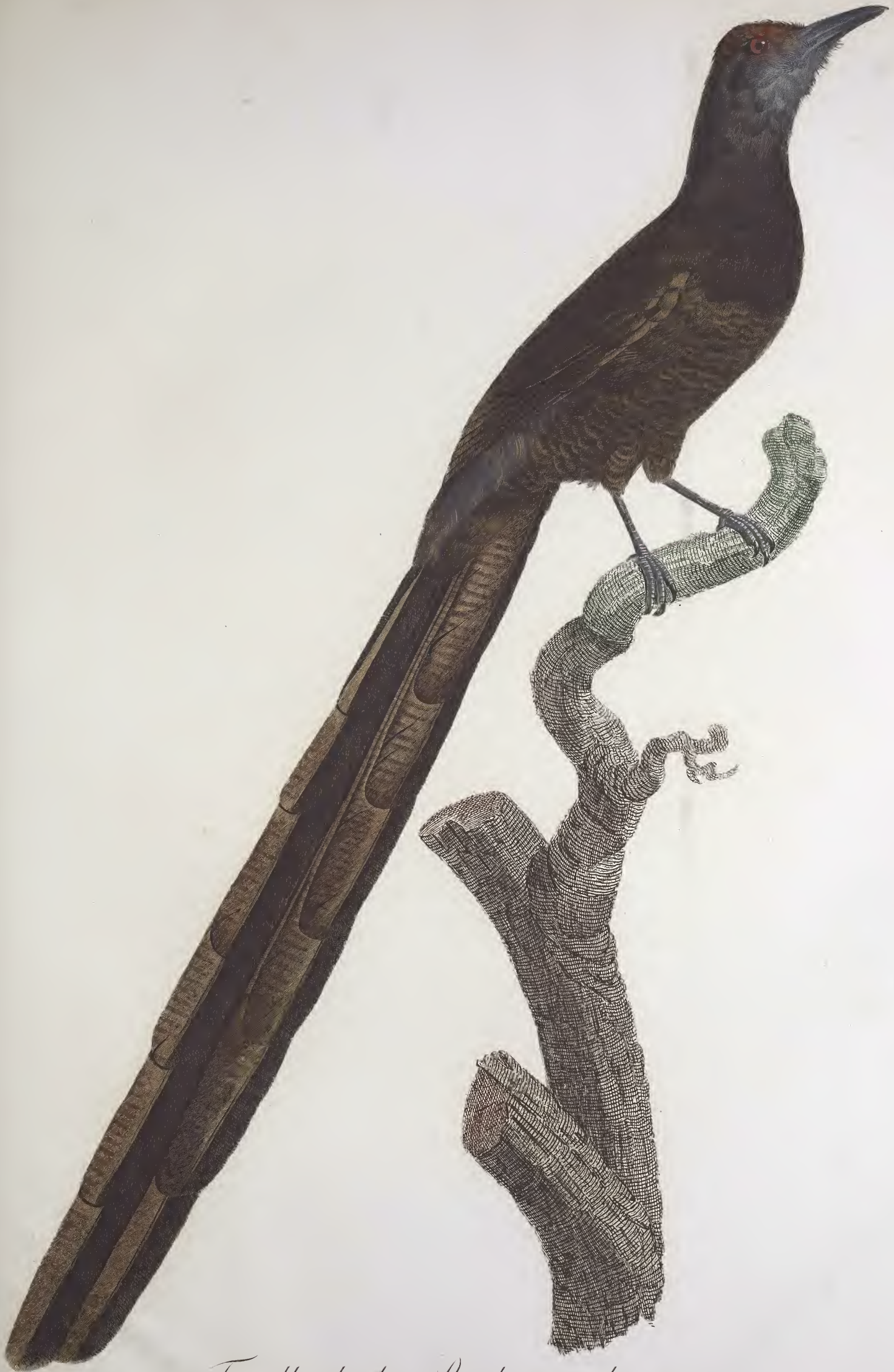
Femelle de la Pic de paradis. N.º 22.