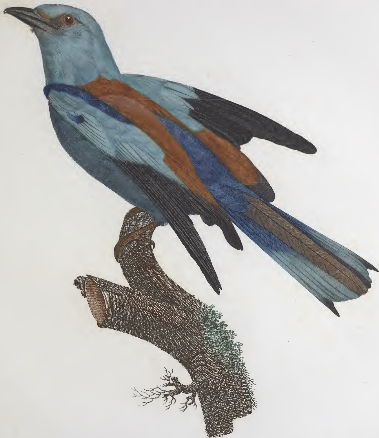
Le Rollier vulgaire, mâle. n.º 32.