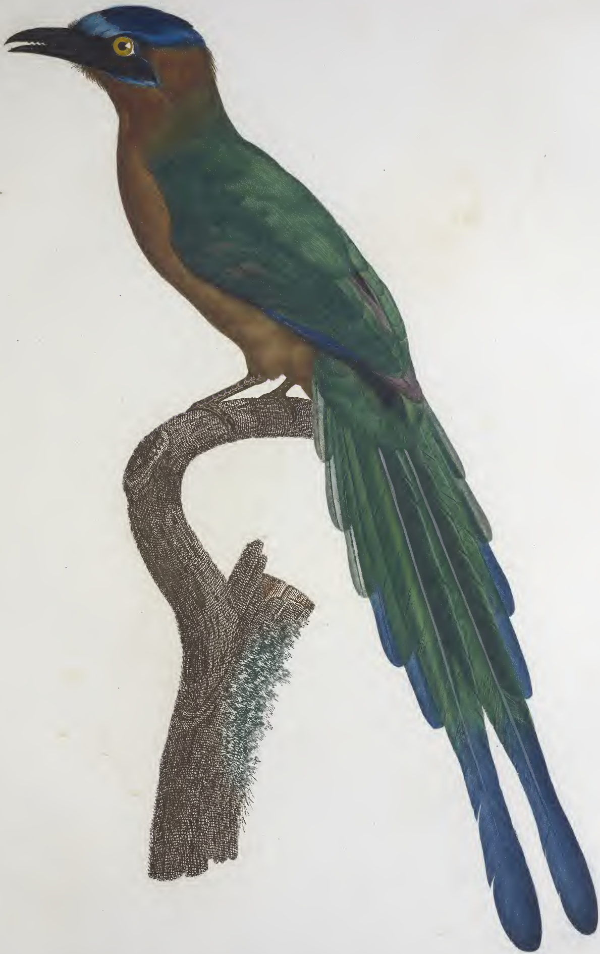
Le Momot dans son jeune âge. N.º 38.