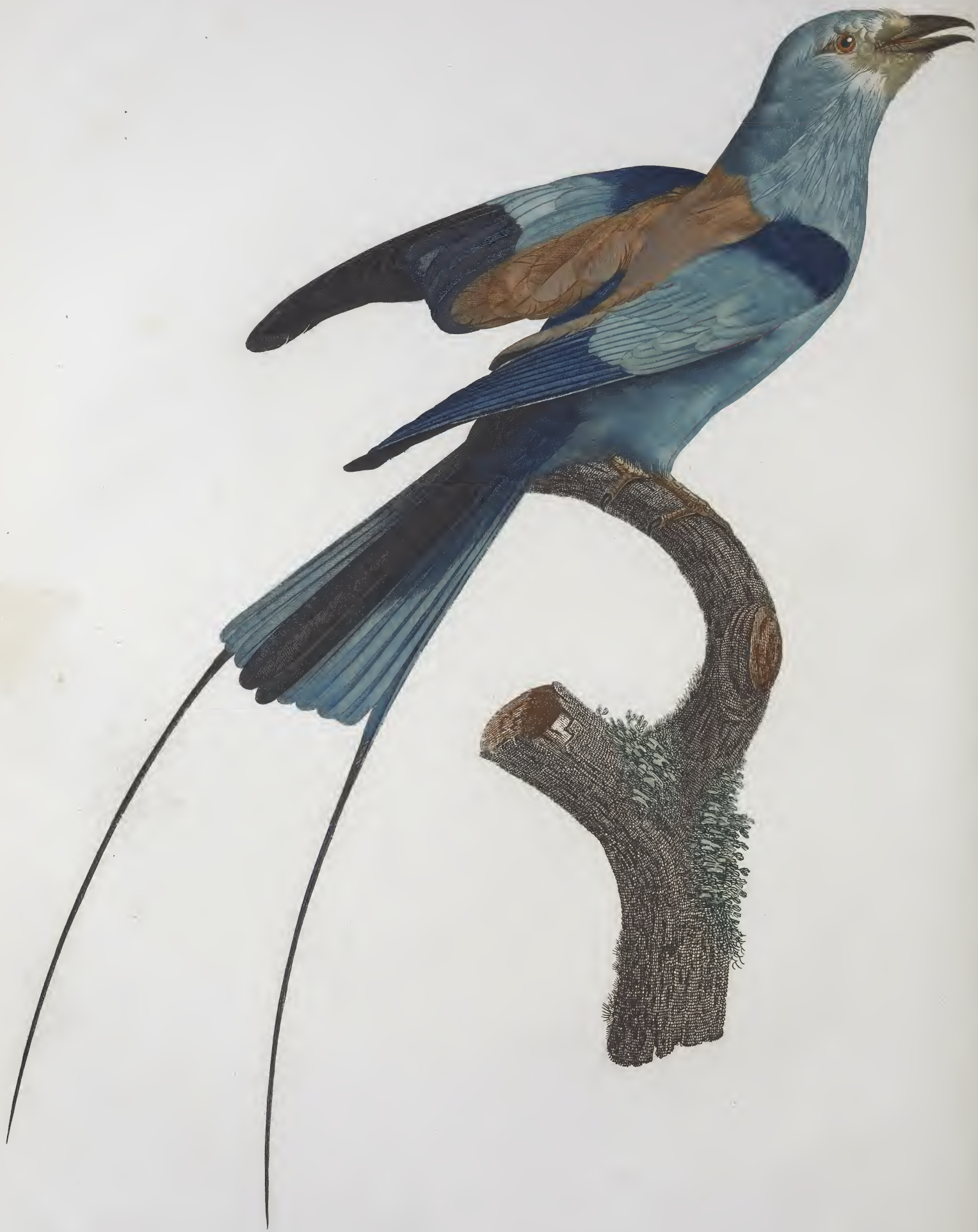
Le Rollier à long brins d'Afrique, mâle. n.º 25.