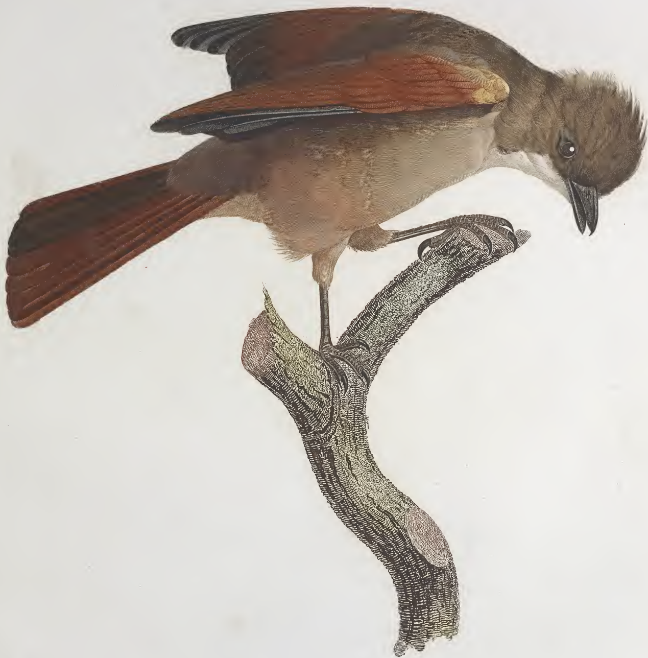
Le Geai brun-roux. n.º 48.