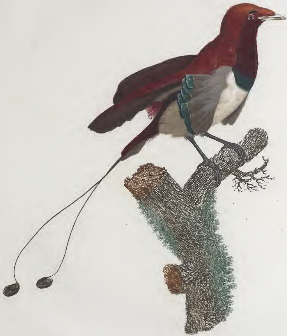
Le Manucode mâle n.º 7.