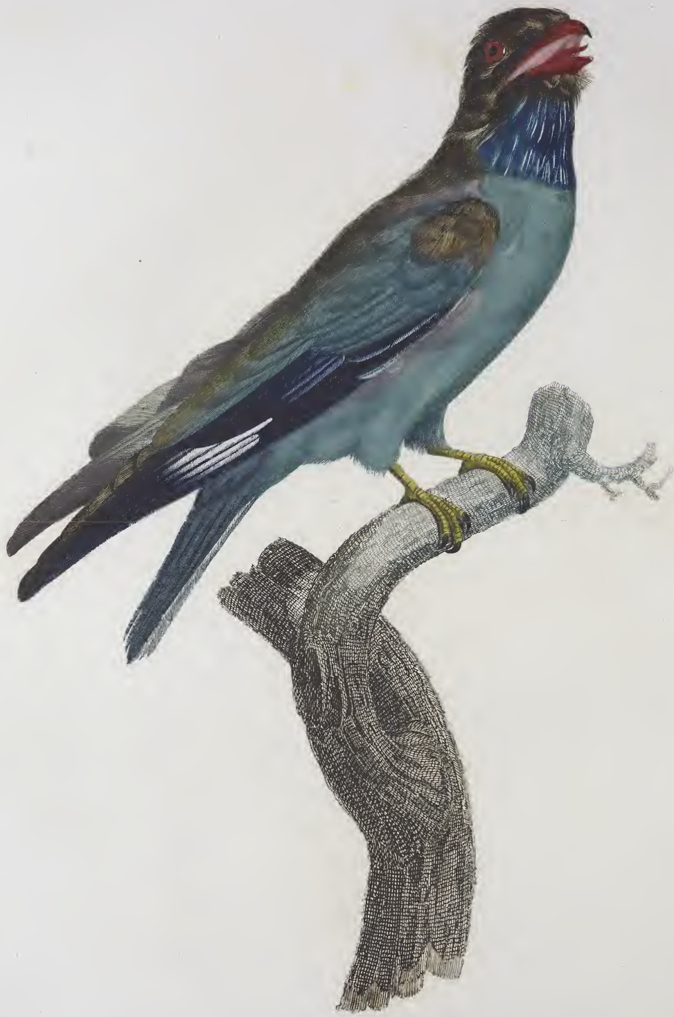
Le Rollet à gorge bleu. N. 56.