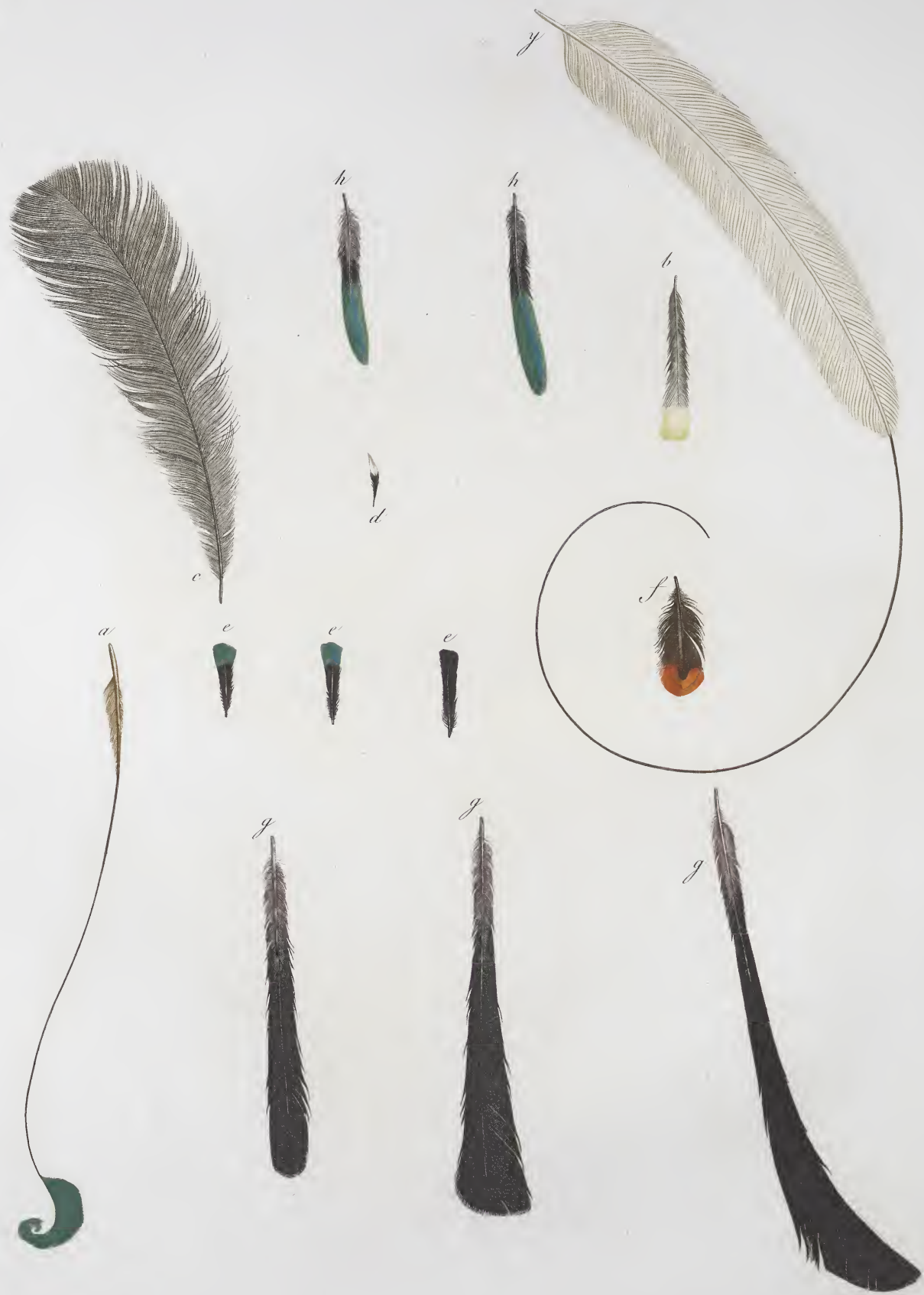
a. Fillet de la queue du Manucode. b. Plume de parement du Magnifique. c. Plume Subalaire du Sifflet. d. Plume, agrandie, du front du Sifflet. e. Plume de la huppe du Sifflet.