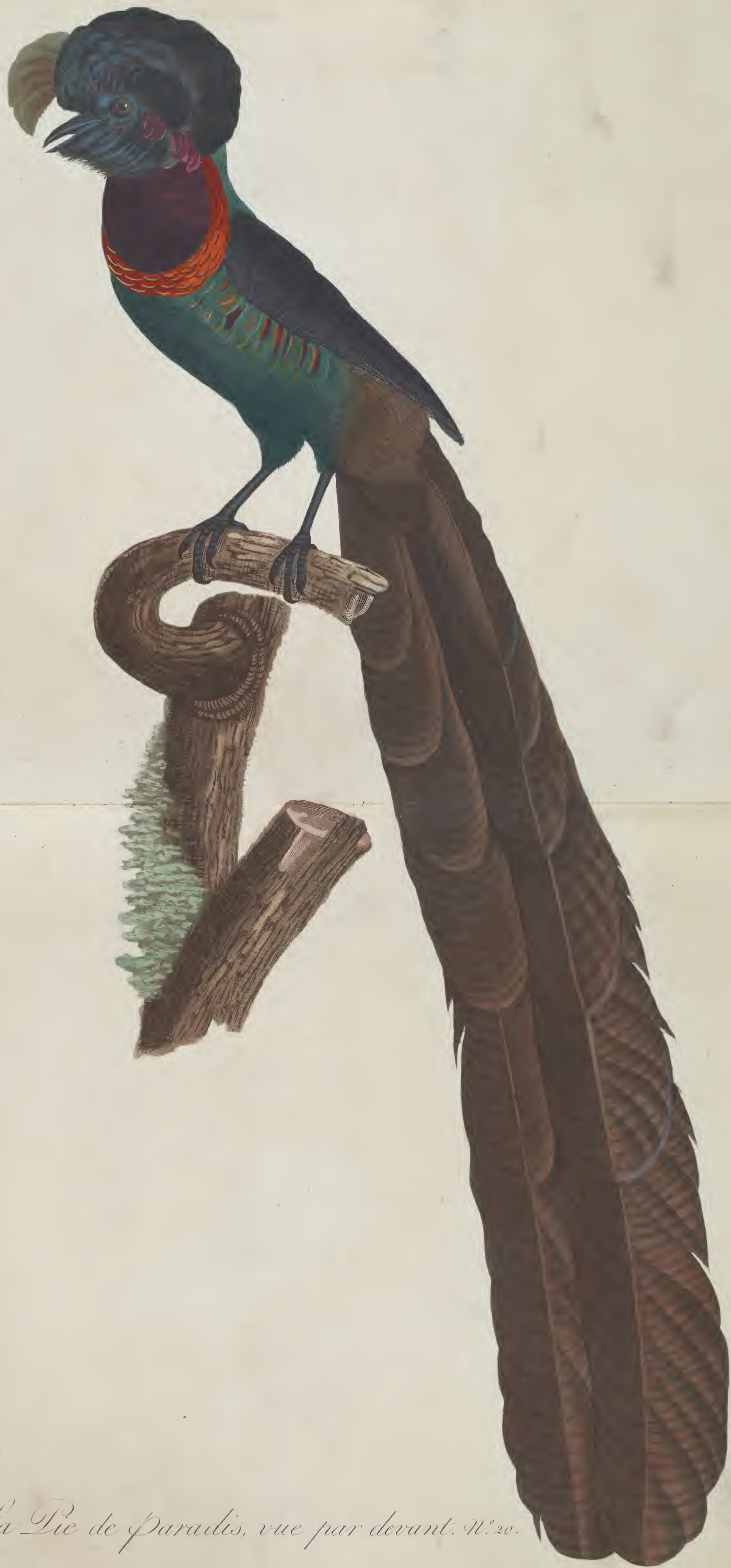
La Pie de Paradis, vue par devant. N.º 20.