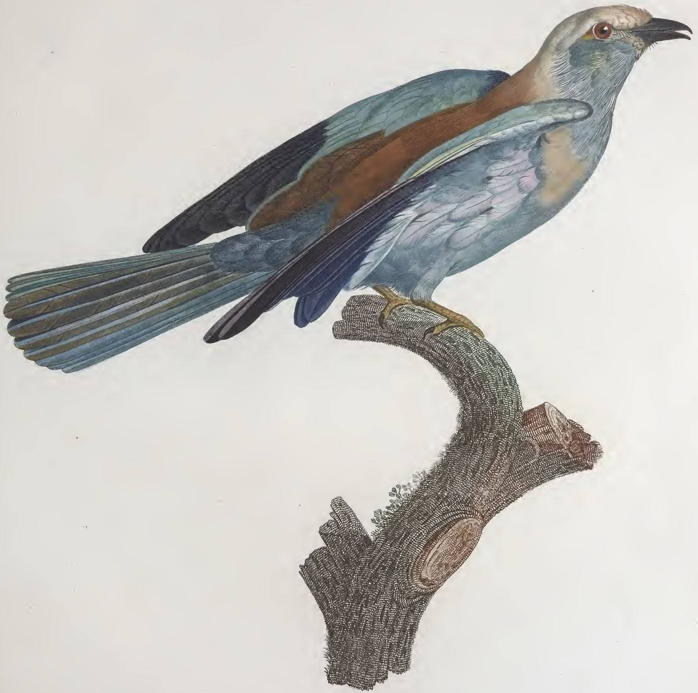
Le Rollier vulgaire, femelle. n.º 33.