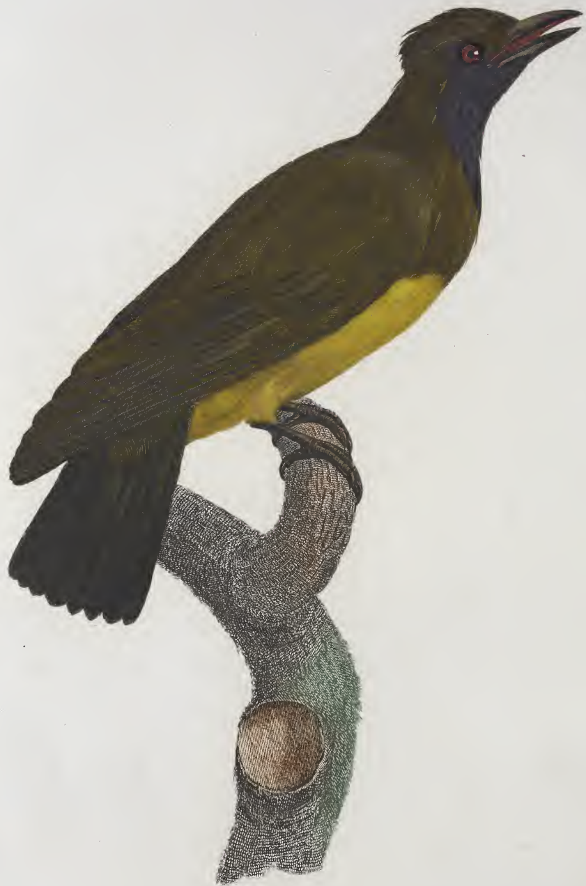
Le Loriot de paradis femelle. n.º 19.