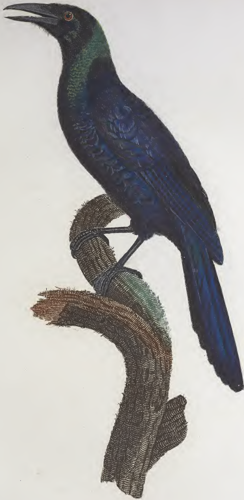
Le Calibé mâle. n°. 23.