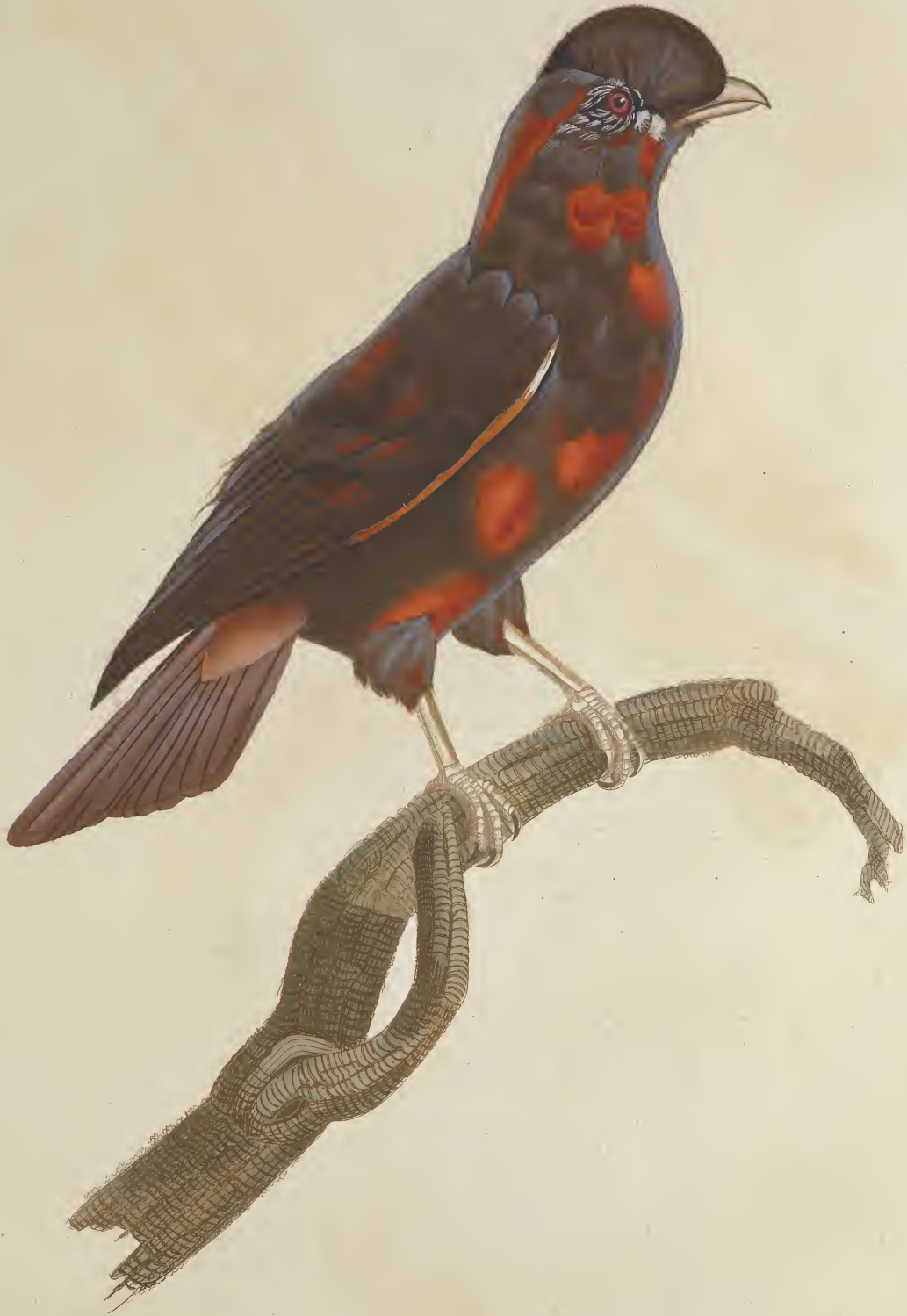
Le Coq de roche jeune âge. n.° 53.