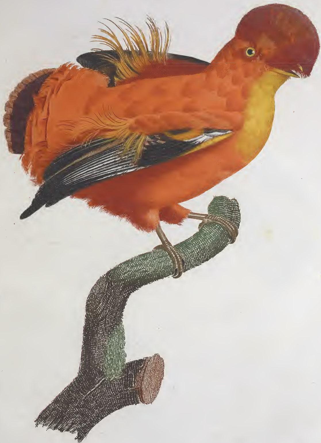
Le Cog de roche mâle. n.º 51.