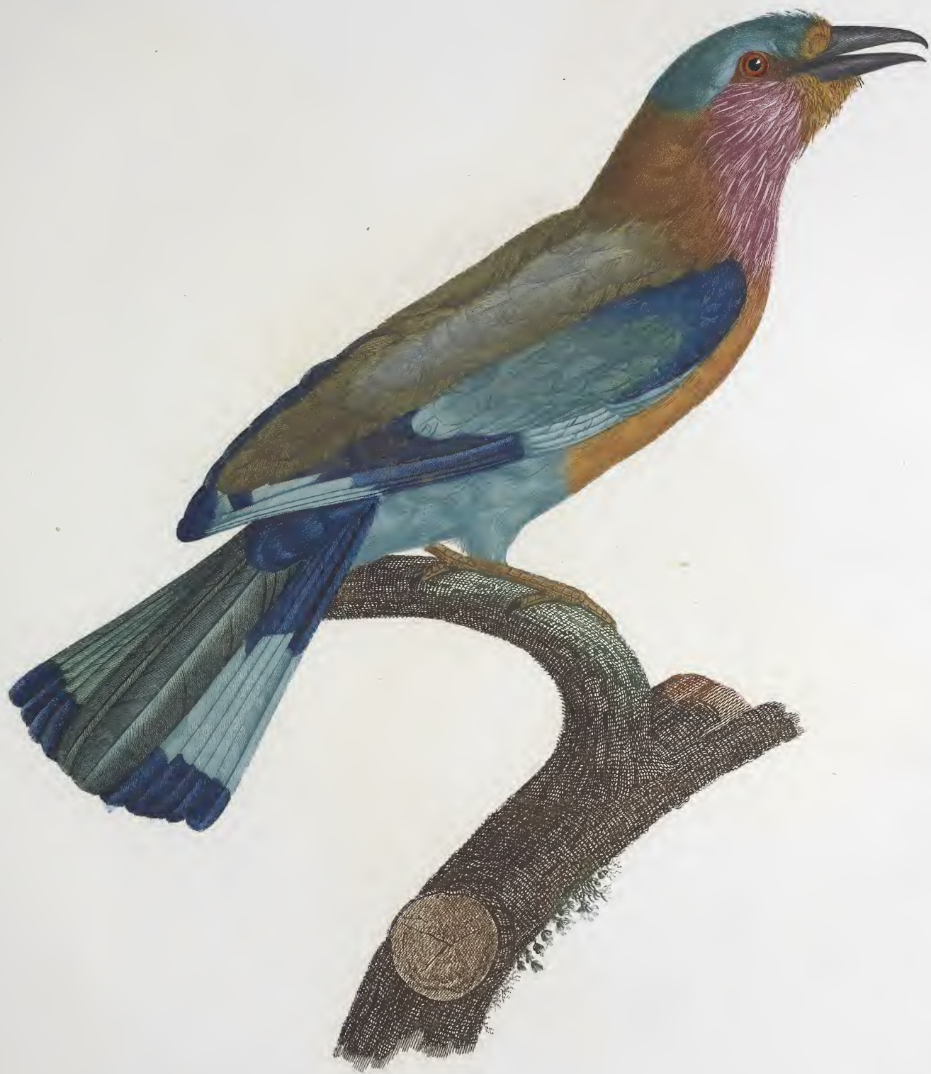
Le Bollier, varié d'Afrique. N. 28.