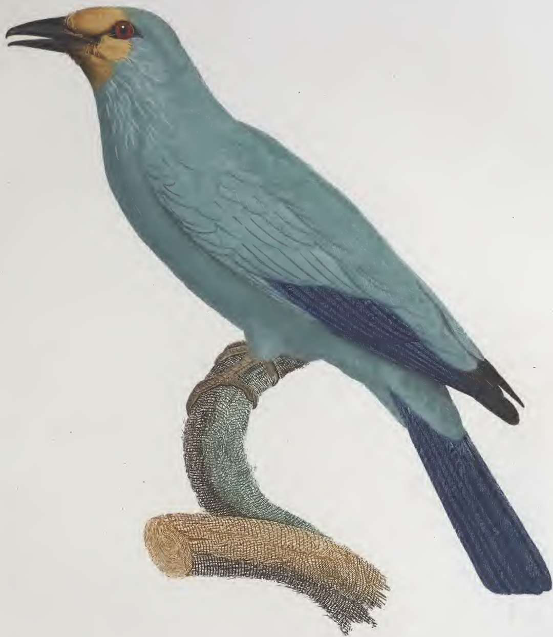
Le Rollier verd. n.º 31.