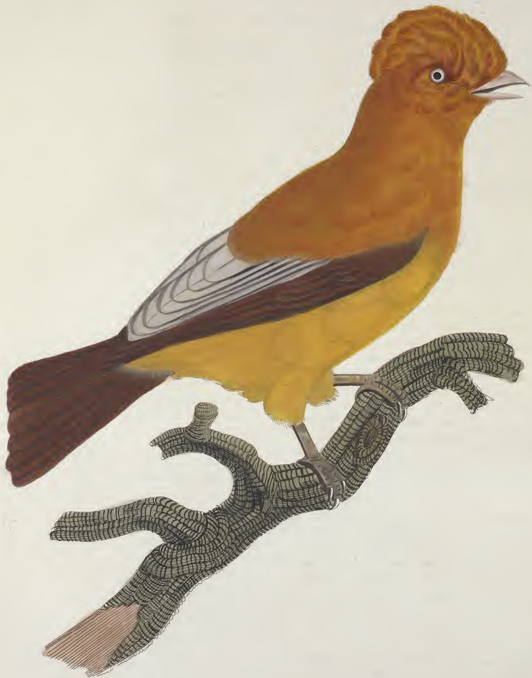
Le coq de roche du Perou. N.º 54.