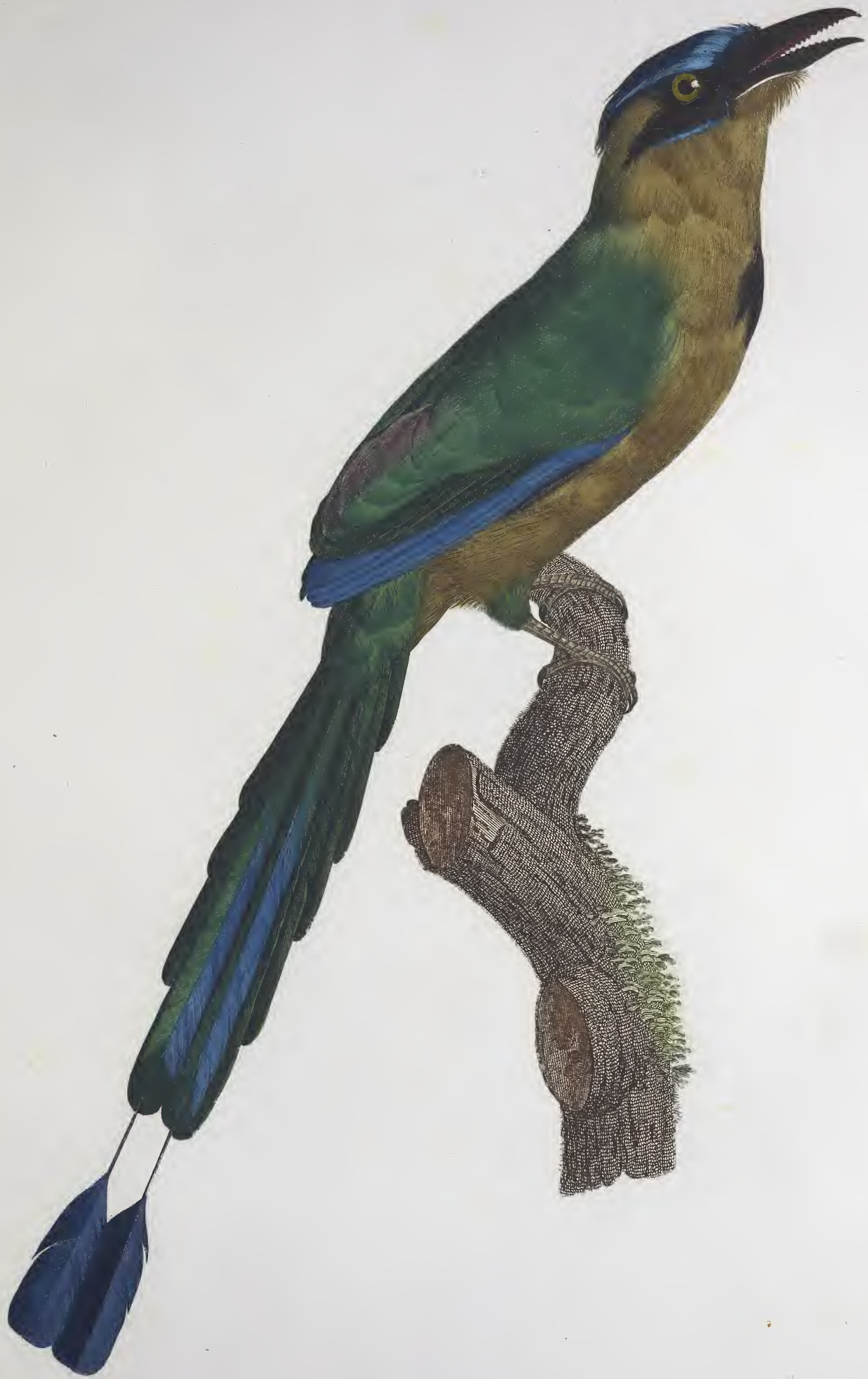
Le Momot adulte, mâle. n° 57.