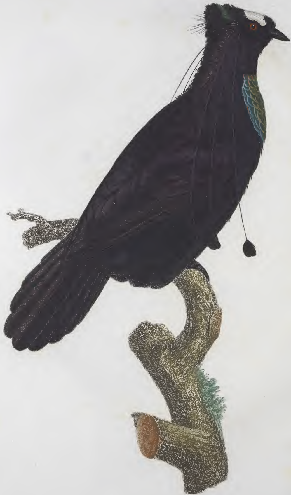
Le Sifilet dans l'état de repos. n.° 13.