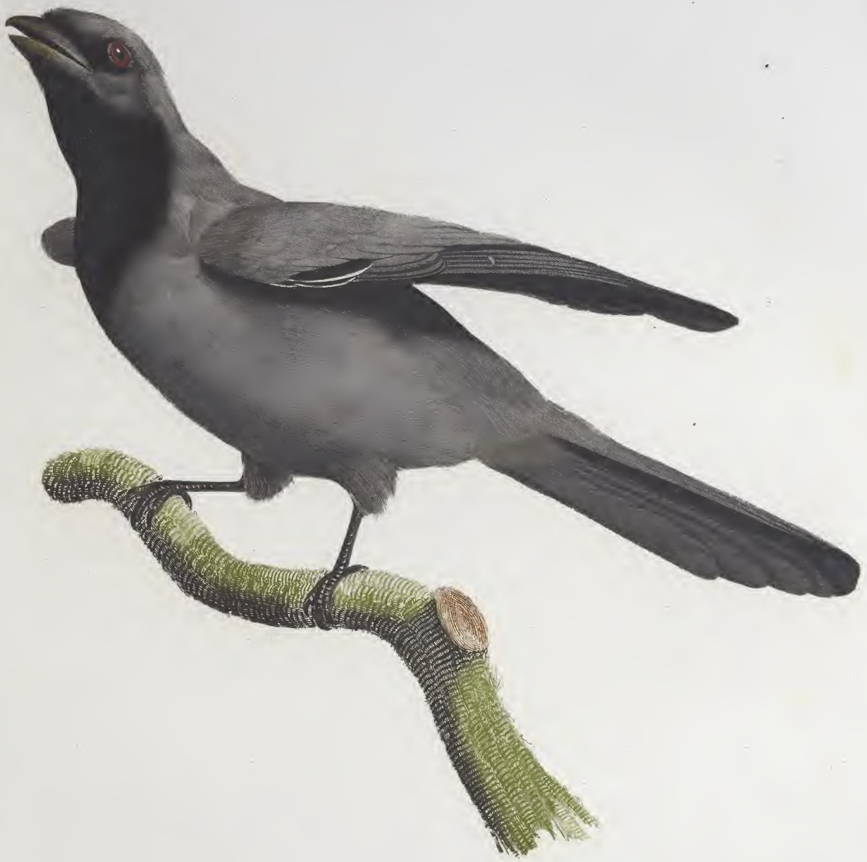
Le Rollier à masque noir. N.º 30.