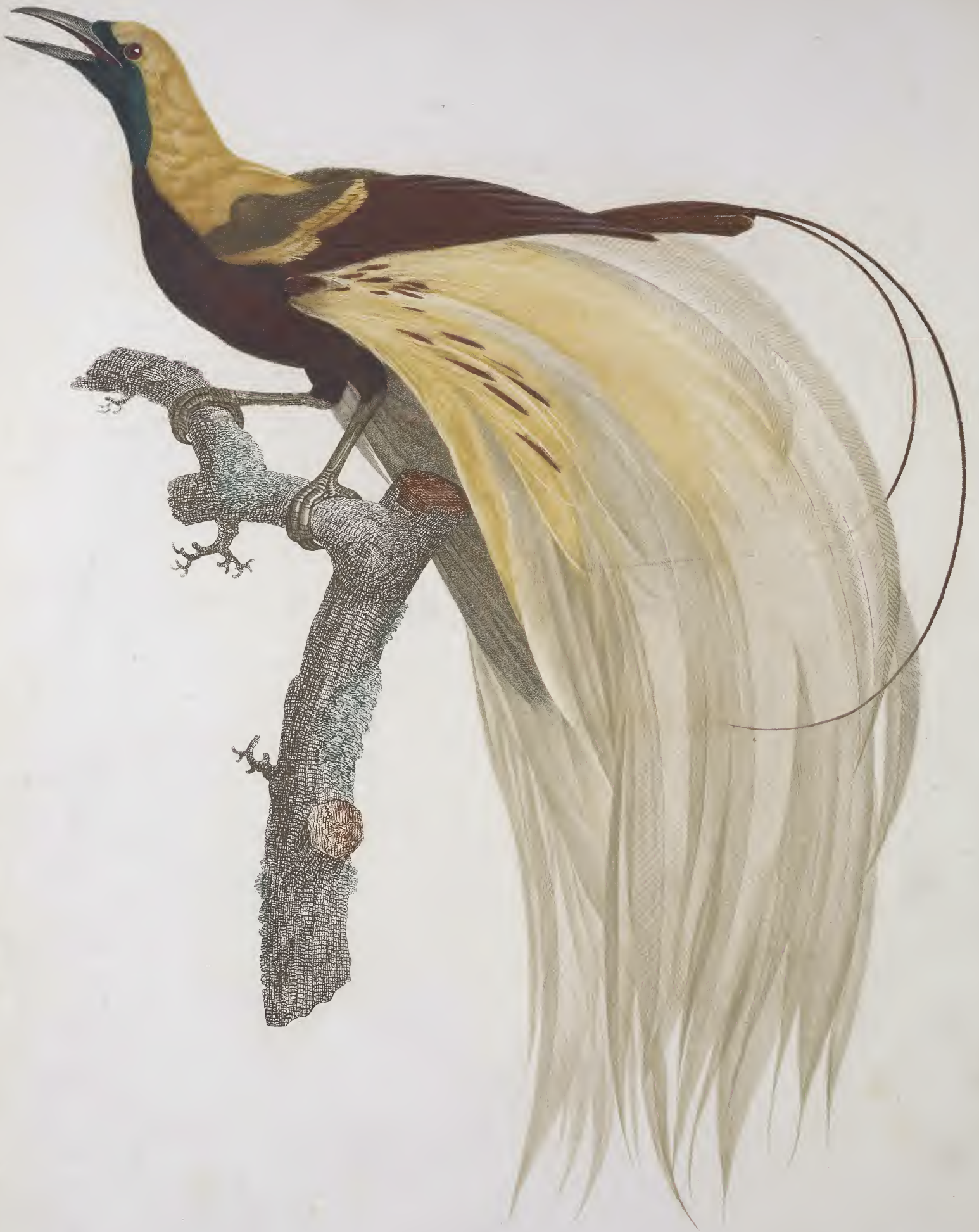
Le petit Oiseau de paradis Emeraude, mâle, n.º 4.