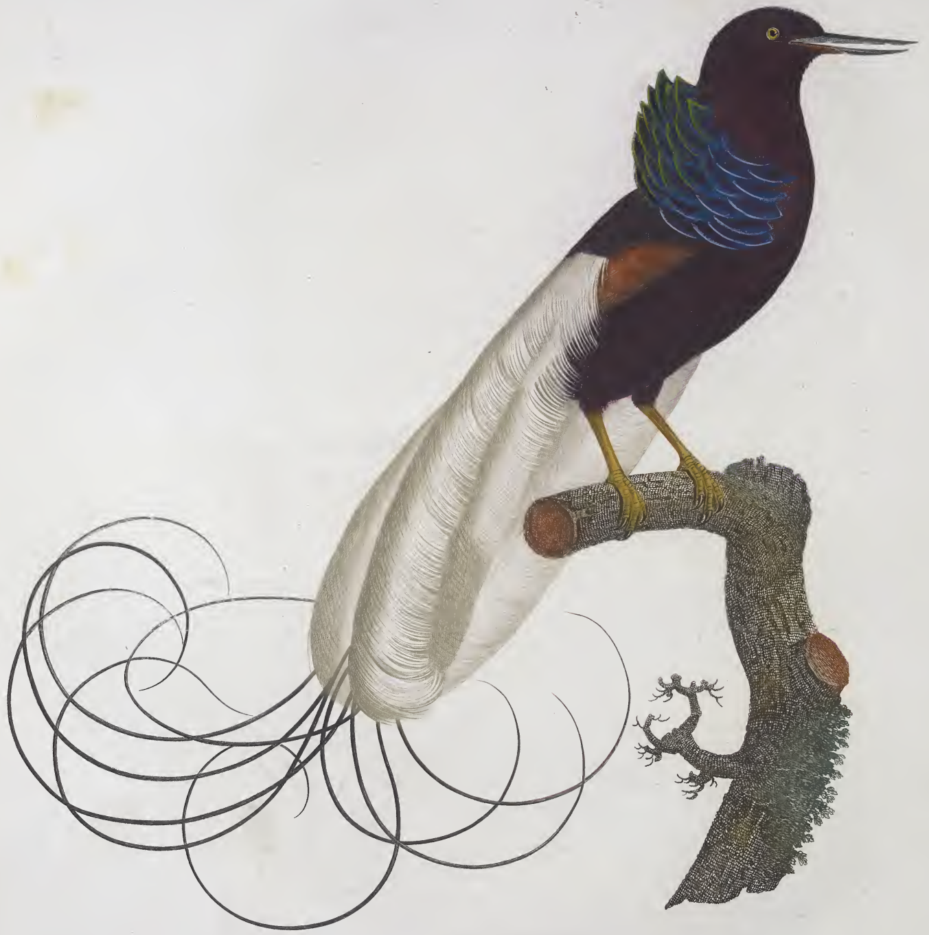
Le Nébuleux, dans l'état du repos. Pl. 17.