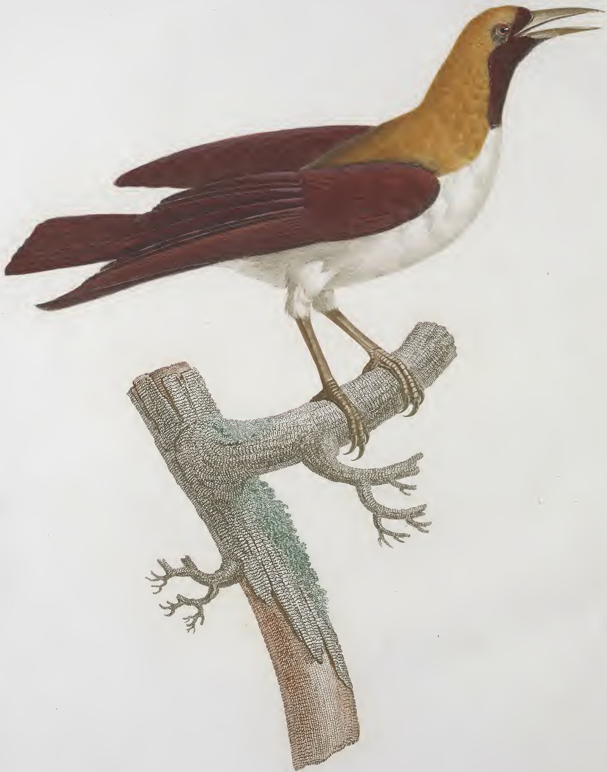
Femelle du grand Ciseau de paradis Émeraude N. 2.