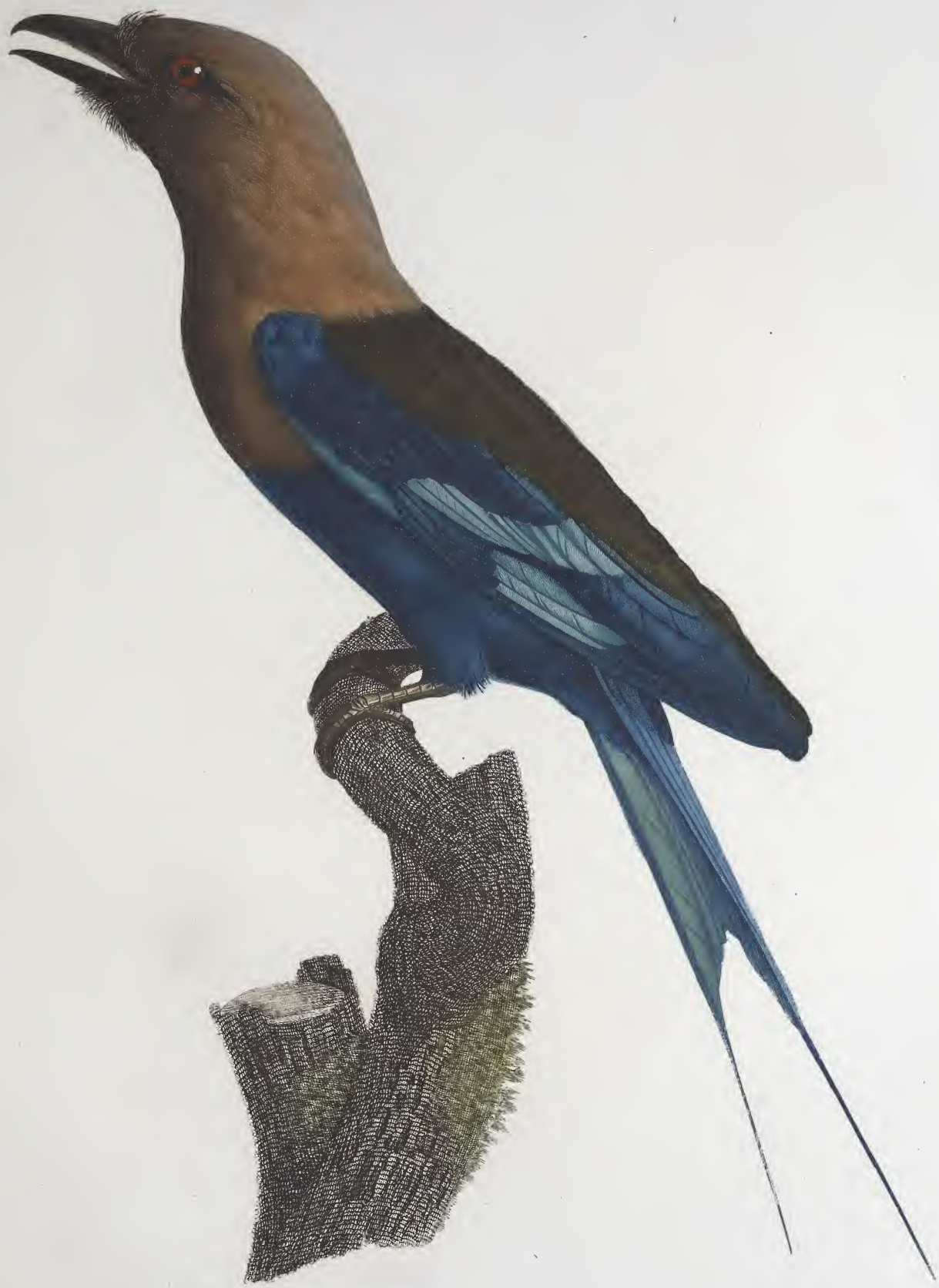
Le Rollier, à ventre bleu. N.º 26.