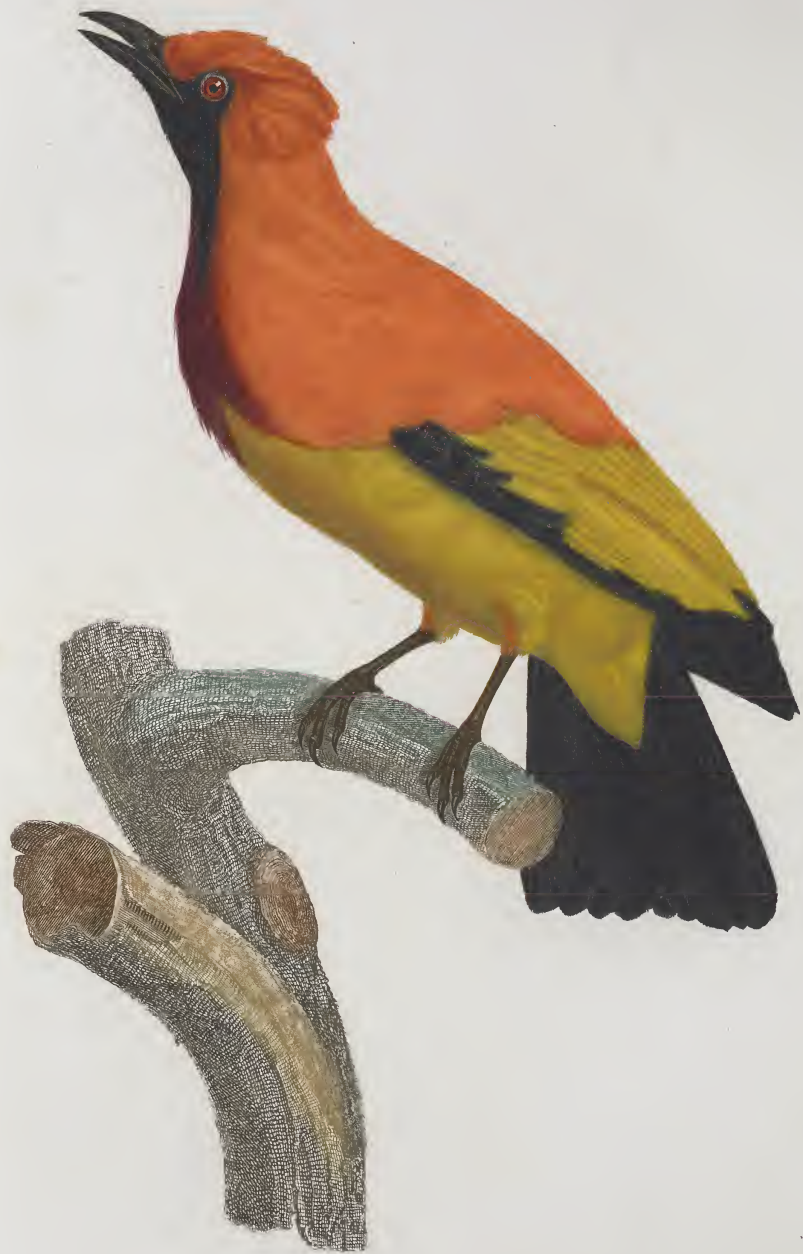
Le Loriot de paradis mâle. n.º 18.