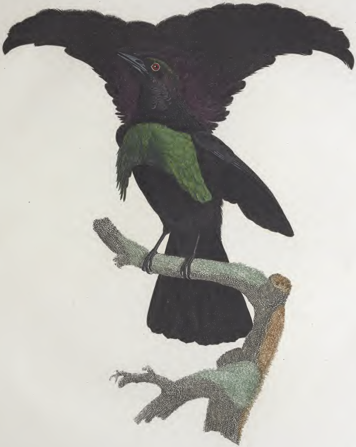
Le Superbe étalant ses parures. N. 15.