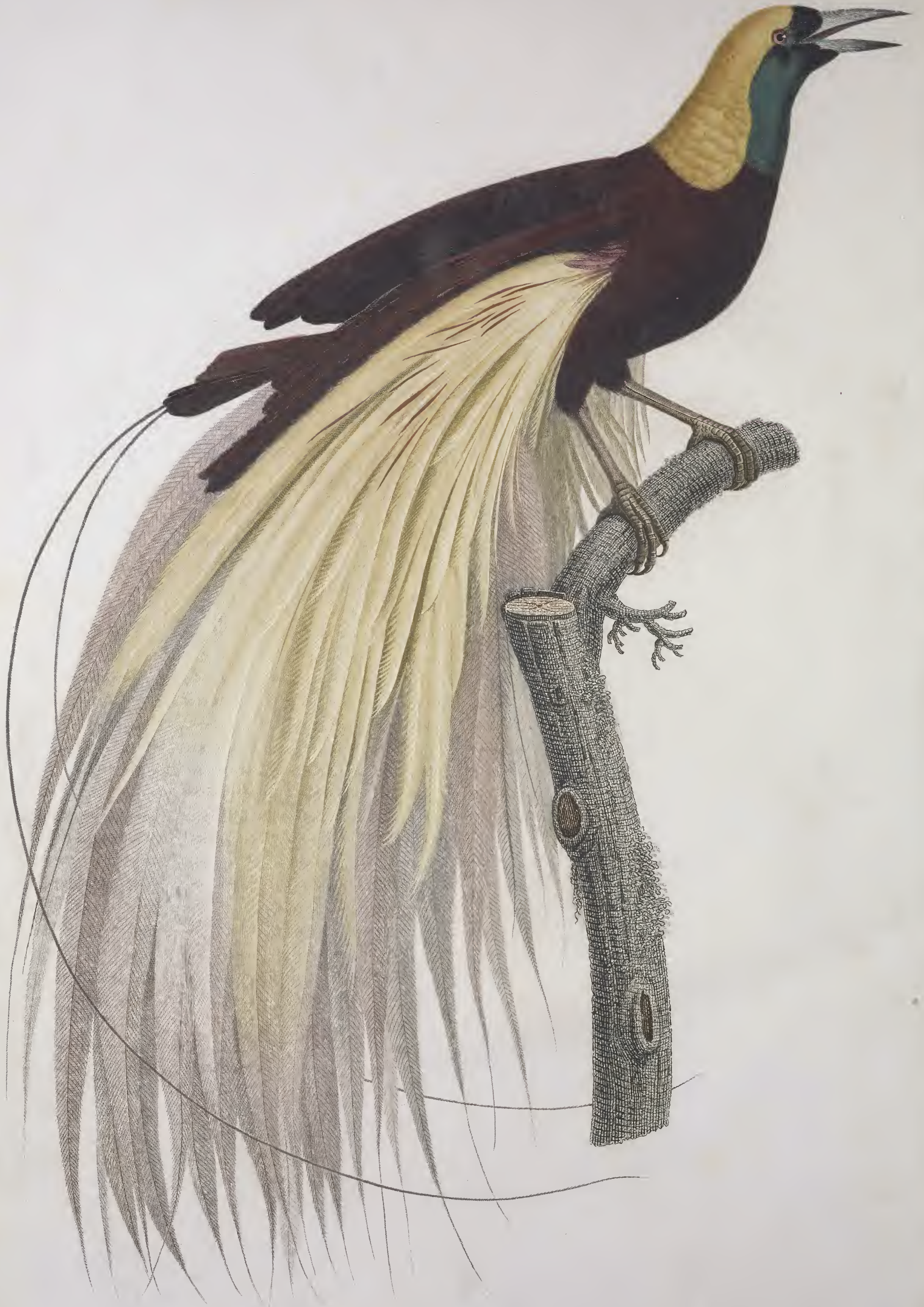
Le grand Oiseau de Paradis, émeraude, mâle. Pl. 1.