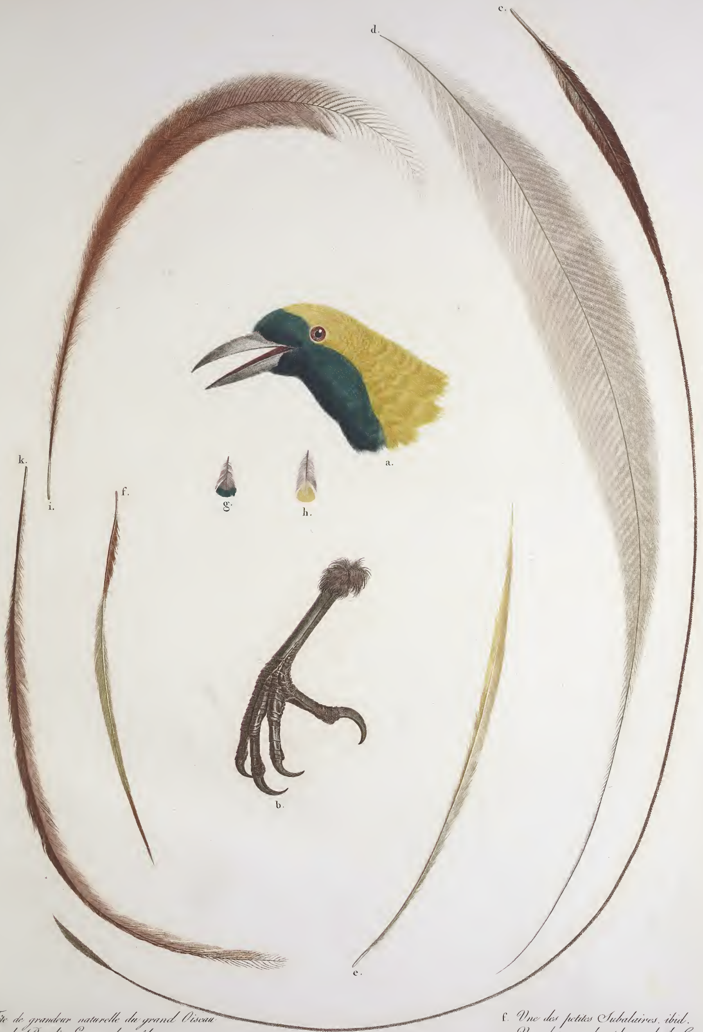
a. Tête de grandeur naturelle du grand Oiseau de Paradis Émeraude, mâle. b. Le Pied, ibid. c. Un des filots de la queue, ibid. d. Une des grandes Subalaires, ibid. e. Une des moyennes Subalaires, ibid.