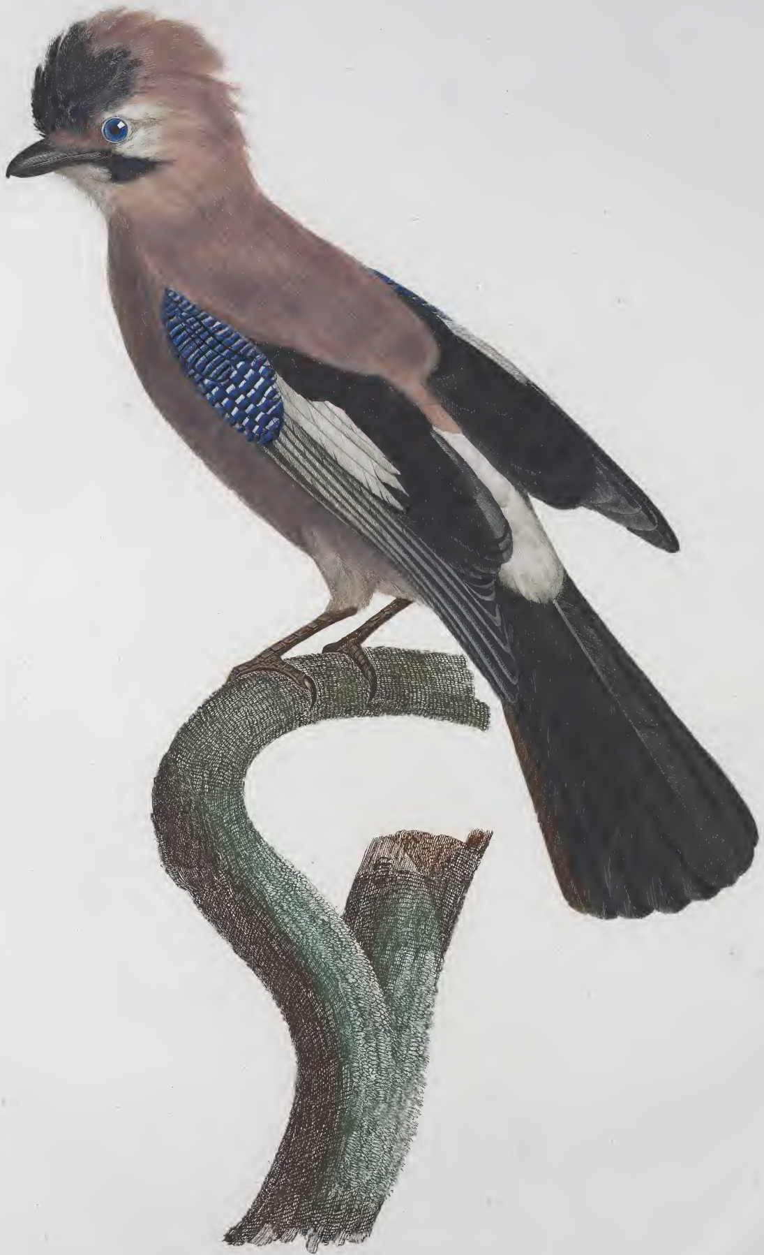
Le Geai d'Europe. n.º 40.