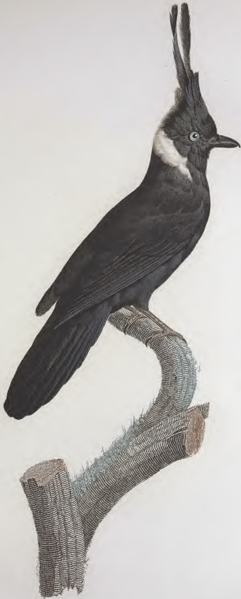
Le Geai Noir à Collier blanc. N.º 42.