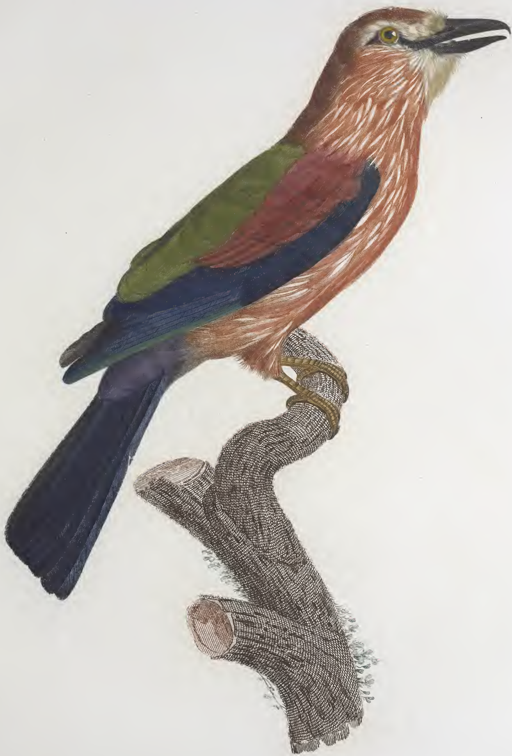
Le Rollier varié d'Afrique, jeune âge. N.º 29.