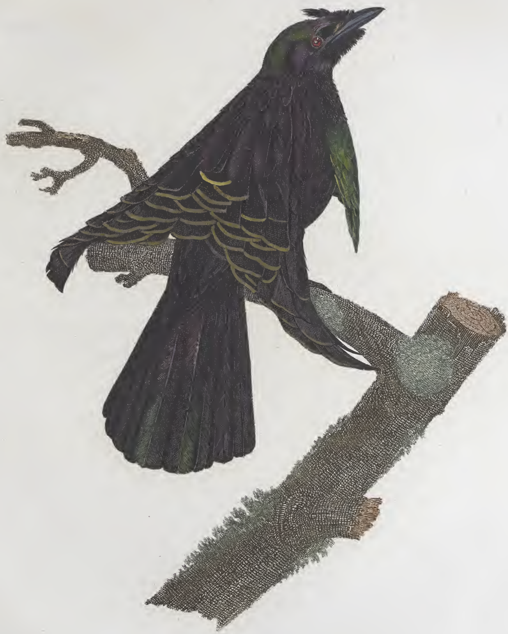
Le Superbe dans l'état du repos. N.º 16.