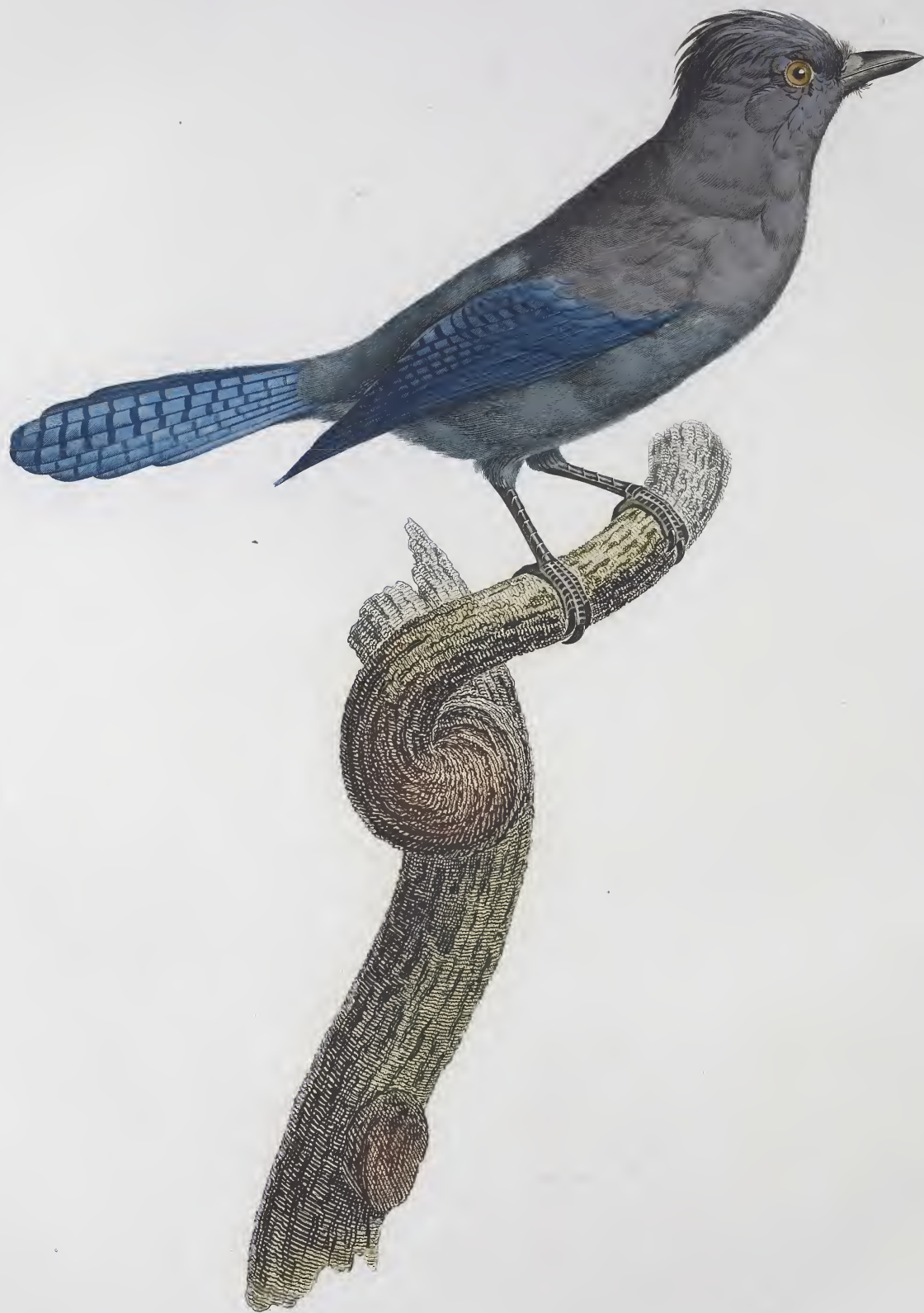
Le Geai bleu-verdin. N. 44.