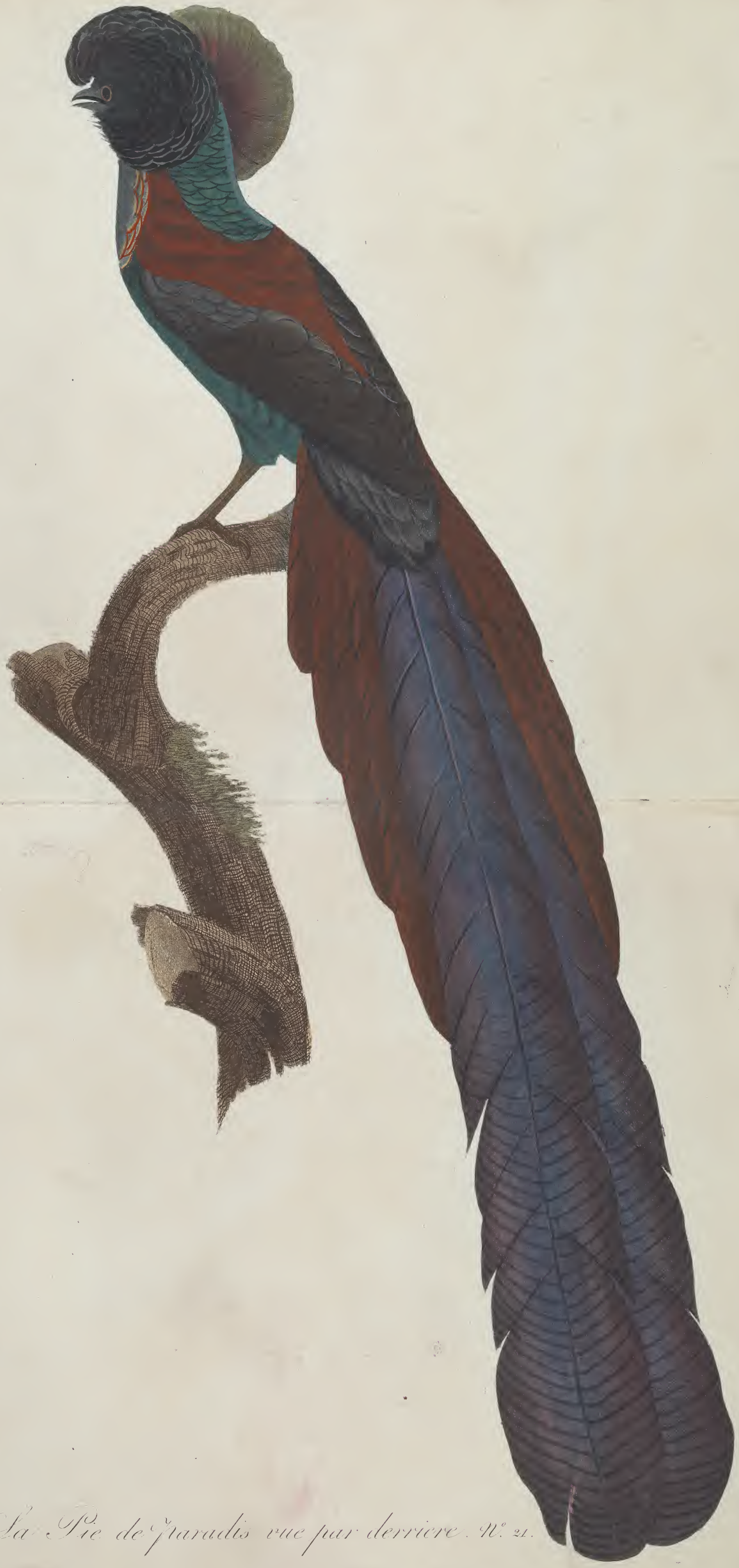
La Pie de paradis vue par derriere. N. 21.