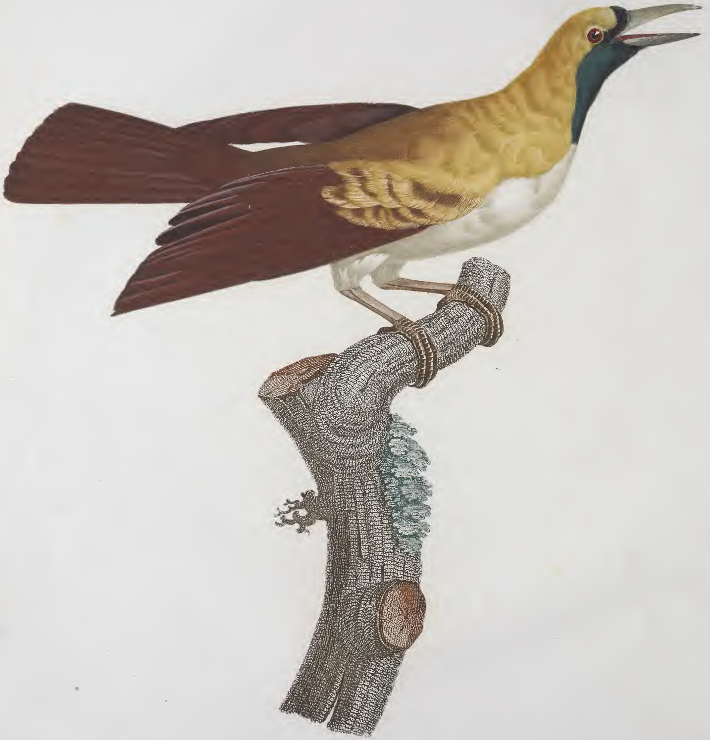
Femelle du petit Oiseau de paradis Emeraude. N.º 5.