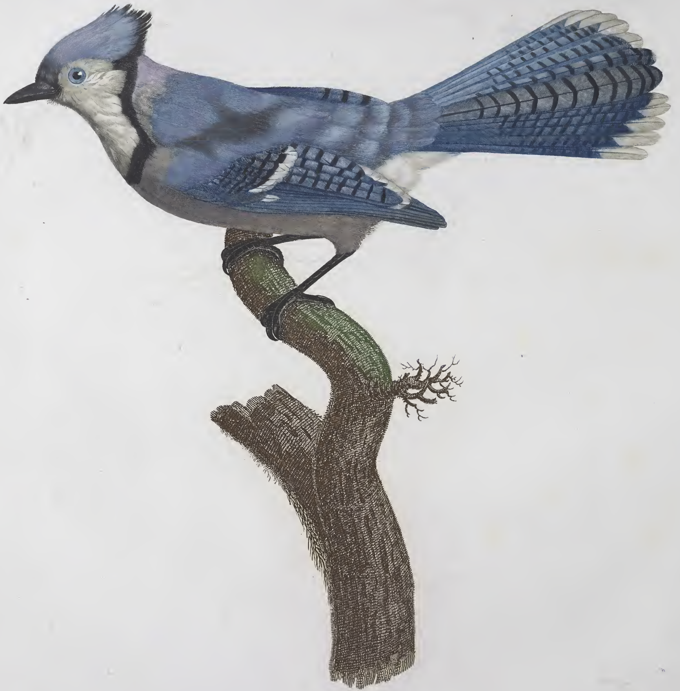
Le Geai Bleu. n.º 45.