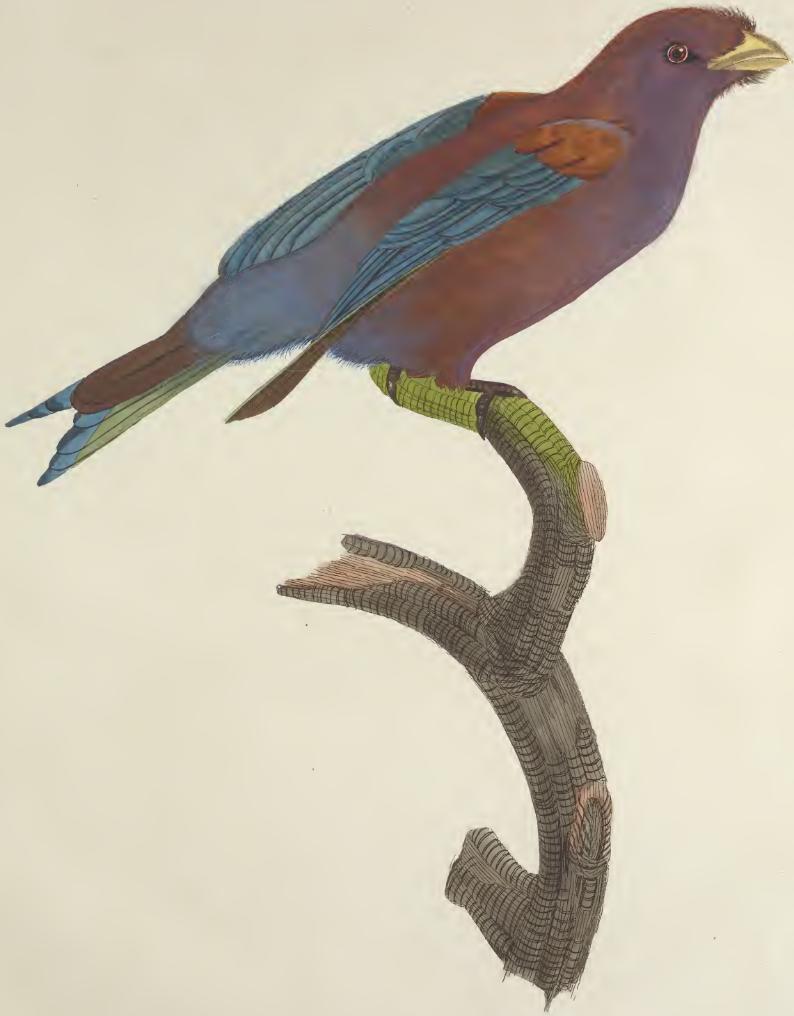
Le petit Rollet violet à gorge bleue. n. 56.