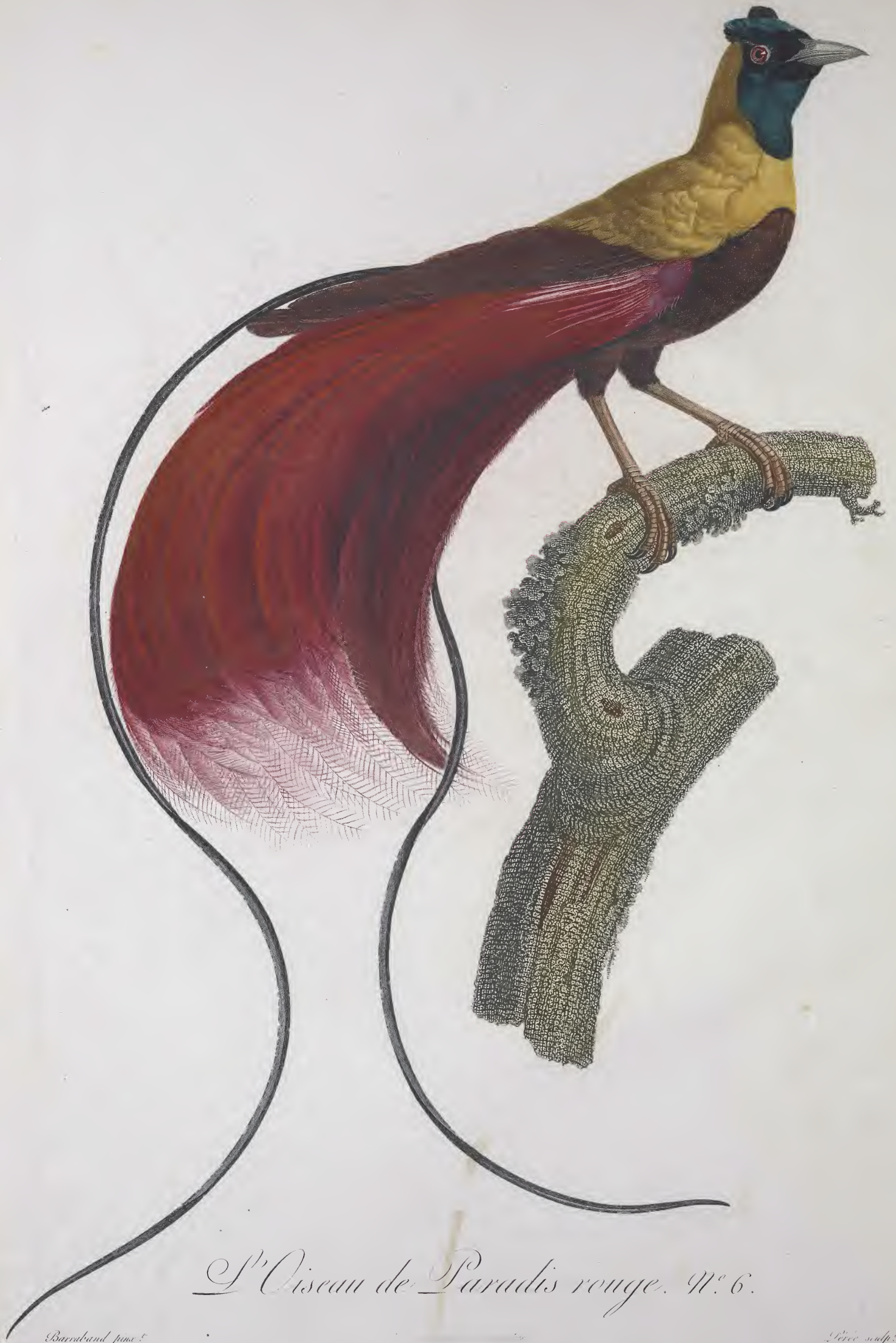
L'Oiseau de Paradis rouge. n.º 6.